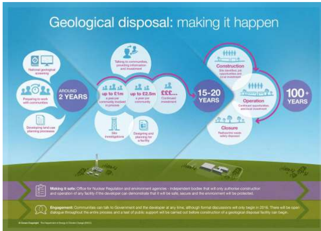
Diagram 2: Sut y gallai'r broses fynd rhagddi

Noder: Cymerwyd y diagram hwn o Bapur Gwyn yr Adran Ynni a Newid Hinsawdd a gyhoeddwyd ym mis Gorffennaf 2014. Mae'n dangos y prosesau a allai gael eu mabwysiadu gan Lywodraeth Cymru, ac a fyddai'n gyson â'r rhai a fabwysiadwyd gan Lywodraeth y DU a Gweithrediaeth Gogledd Iwerddon. Fodd bynnag, bydd mabwysiadu'r prosesau hyn yn dibynnu ar ganlyniad yr ymgynghoriad hwn.