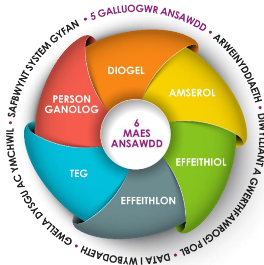
Diagram i ddangos y chwe maes ansawdd a gefnogir gan y pum galluogwr ansawdd.