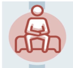
gwasanaethau therapiau seicolegol / cwnsela