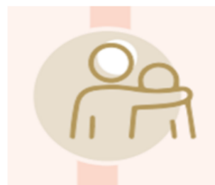
rhwydweithiau neu grwpiau cefnogaeth gan gymheiriaid