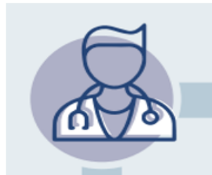
y meddyg teulu neu'r tîm gofal sylfaenol

Asiantaethau eraill sy'n cyfrannu at siwrneiau profedigaeth pobl yng Nghymru sy'n byw gyda phrofedigaeth yn sgil hunanladdiad posibl.