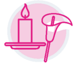
trefnwyr angladdau, gweinyddion

Asiantaethau eraill sy'n cyfrannu at siwrneiau profedigaeth pobl yng Nghymru sy'n byw gyda phrofedigaeth yn sgil hunanladdiad posibl.