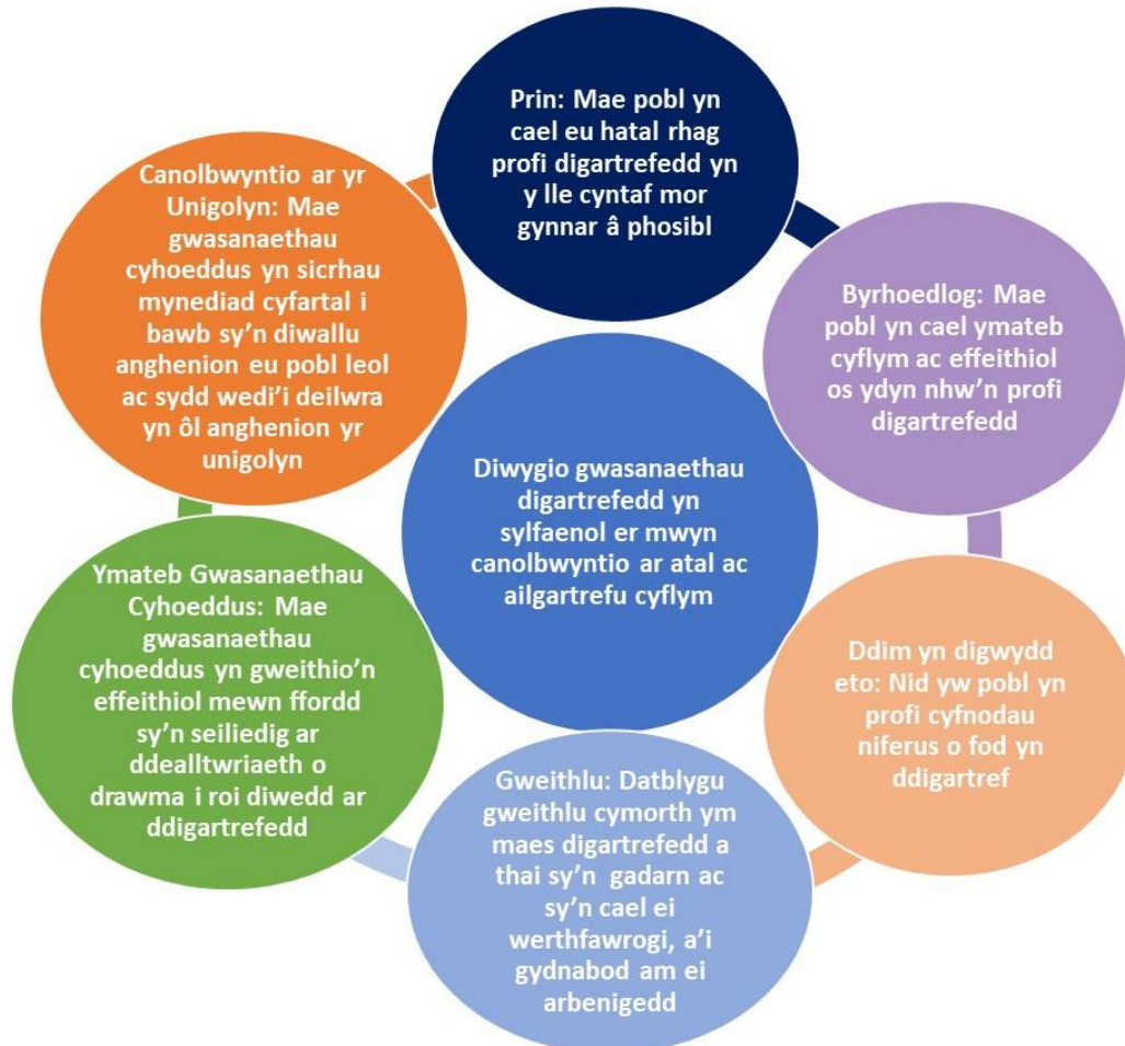
Diagram 2: Canlyniadau strategol

3.1 Mae Diagram 2 isod yn nodi'r chwe Chanlyniad Strategol. Maent wedi'u dewis i gyfleu prif themâu ein Cynllun Gweithredu ar gyfer Rhoi Diwedd ar Ddigartrefedd, sef gwneud digartrefedd yn beth prin a byrhoedlog, na fydd yn digwydd eto, a'r hegwyddorion polisi sy'n sail iddynt.