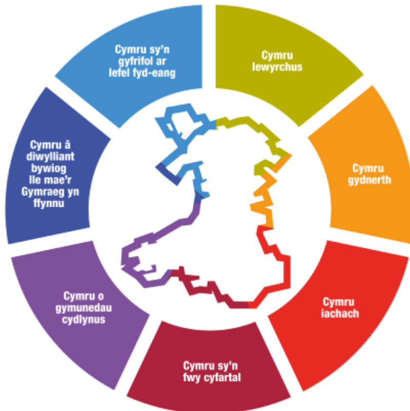
Ffigur 2: Ein saith nod llesiant cysylltiedig ar gyfer Cymru