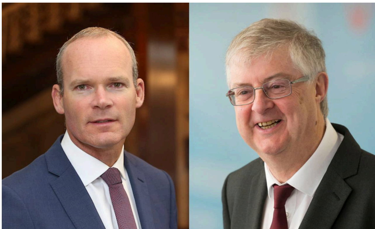
Simon Coveney TD, Y Gweinidog Materion Tramor Mark Drakeford AS, Prif Weinidog Cymru

Mae Cymru ac Iwerddon yn gymdogion agos. Mae ein perthynas gref a chadarnhaol wedi'i hadeiladu ar gysylltiadau hynafol a dealltwriaeth ddiwylliannol ddofn. Mae hi hefyd yn berthynas fodern a llewyrchus, sydd wedi'i