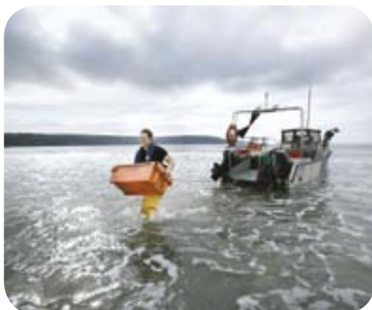
Dash Shellfish, Broadhaven, Sir Benfro

Byddwn yn ceisio sicrhau'r buddion mwyaf posibl o'r cronfeydd sydd ar gael yng Nghymru. Rydym am weld buddsoddiadau yn y dyfodol yn cael eu defnyddio i ddatblygu cymunedau pysgota, arloesi mewn meysydd megis diogelu'r amgylchedd, casglu data, ymchwil wyddonol, dyframaethu a rheolaeth ar weithrediadau pysgota.