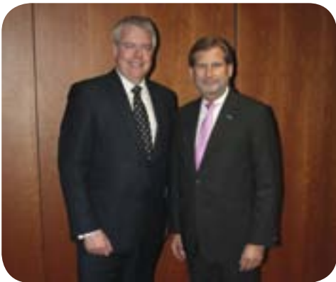
Y Prif Weinidog Carwyn Jones gyda Chomisynydd Polisi Rhanbarthol Ewrop Johannes Hahn.

Rydym yn ymrwymedig i sicrhau'r budd mwyaf posibl o'r Cronfeydd Strwythurol a neilltuir i Gymru. Byddwn yn cefnogi nifer llai o brosiectau mwy strategol a'n bwriad yw canolbwyntio ar greu twf a swyddi cynaliadwy.