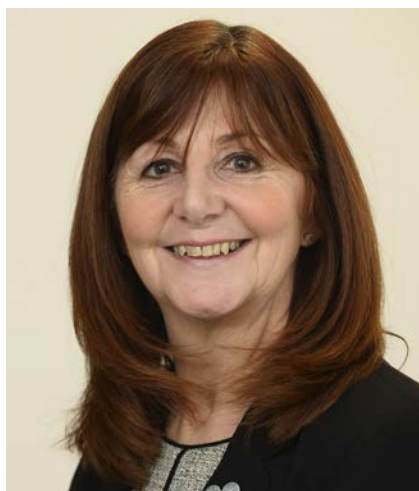
Lesley Griffiths Gweinidog yr Amgylchedd, Ynni a Materion Gwledig.

Rwy'n croesawu lansiad y cynllun hwn er mwyn mynd i'r afael â'r bygythiad o ymwrthedd gwrthficrobaidd (AMR) mewn anifeiliaid ac yn yr amgylchedd yng Nghymru. Mae'n amlinellu ein cynigion i drawsnewid y ffordd rydym yn ymdrin â'r bygythiad mawr hwn.