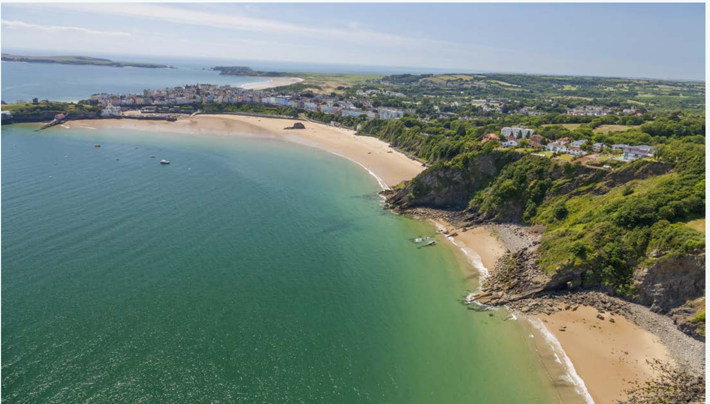
© Hawlfraint y Goron (2014) Croeso Cymru