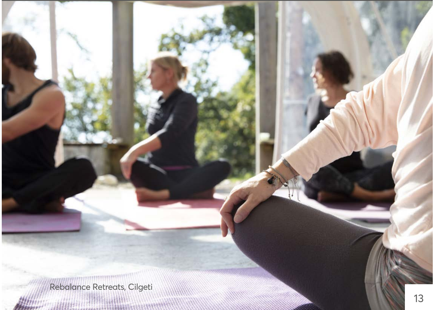
Rebalance Retreats, Cilgeti