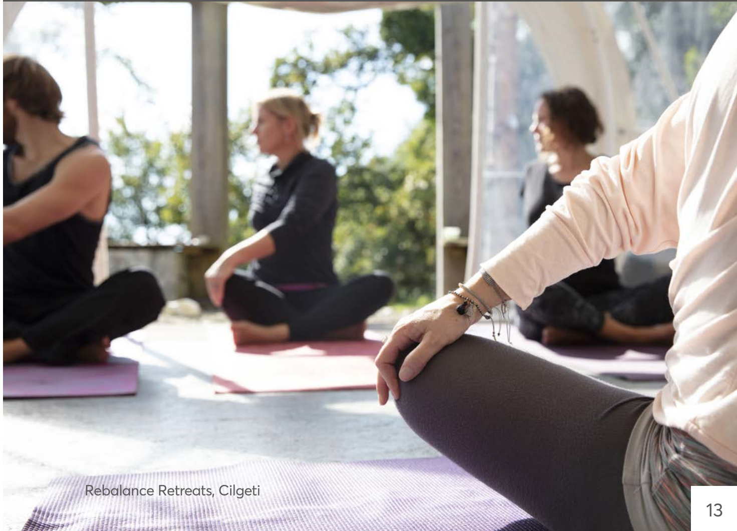
Rebalance Retreats, Cilgeti