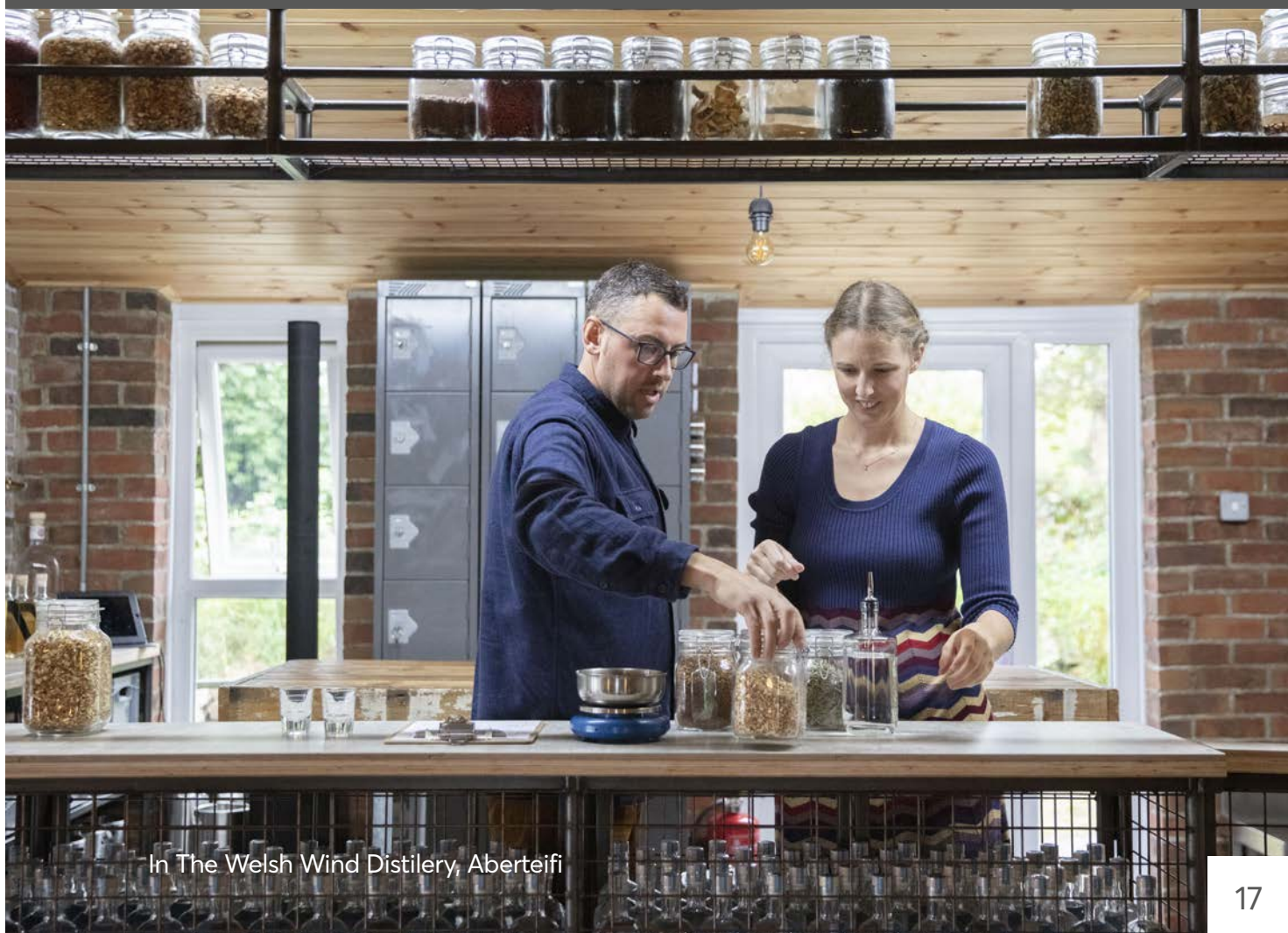
In The Welsh Wind Distillery, Aberteifi