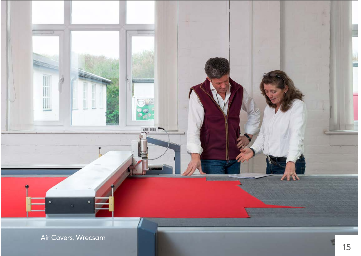
Air Covers, Wrecsam