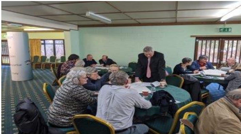
Trafod senarios cynllunio gyda Chyngorwyr Cymuned yn Llanfair-ym-Muallt

Cynhaliwyd digwyddiadau a fwriadwyd i gyflwyno Cynghorau Cymuned i waith yr Arolygiaeth Gynllunio ac i archwilio sut gallant ymgysylltu â'r system gynllunio'n effeithiol. Gwnaethom esbonio ein ffordd o wneud penderfyniadau ynglŷn ag apeliadau, archwiliadau o gynlluniau lleol a cheisiadau DNS, a'r materion sy'n berthnasol ac yn amherthnasol. Yna, gan weithio gyda Chymorth Cynllunio Cymru, gwnaethom hwyluso sesiynau gweithdy i drafod sut gall Cynghorau Cymuned ddefnyddio eu hadnoddau i gael y gorau i'w cymunedau.