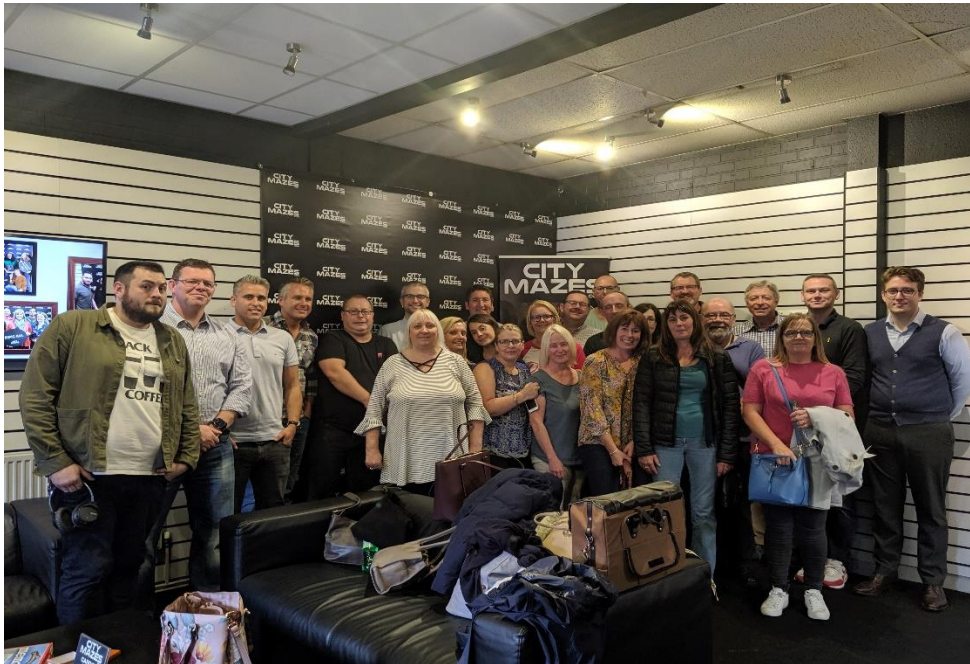
Fe ddihangon ni!

Trefnwyd sesiwn flasu ar y Gymraeg i'r tîm dan arweiniad Prifysgol De Cymru. Mae Arolygiaeth Gynllunio Cymru yn ystyried hybu defnydd o'r Gymraeg o ddifrif, ac er bod siaradwyr Cymraeg yn y tîm, yn ogystal â'r rhai sy'n dysgu siarad Cymraeg yn annibynnol, mae sicrhau lefel sylfaenol o sgiliau ar draws y tîm cyfan yn dangos ein hymrwymiad i hyrwyddo'r iaith a gwella'r gwasanaeth a ddarparwn i'n cwsmeriaid Cymraeg eu hiaith.