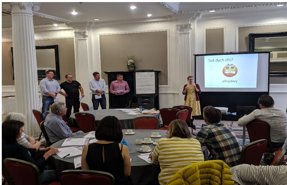
Sut dych chi?