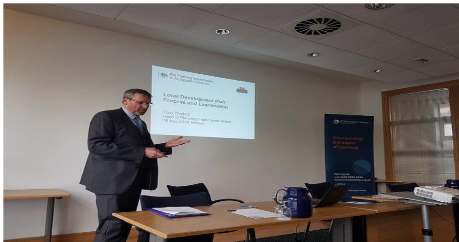
Annerch cynhadledd RTPI yn Belfast.