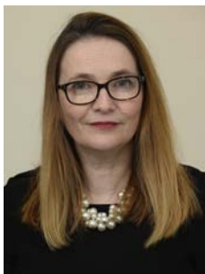
Kirsty Williams AS Y Gweinidog Addysg

Hoffem ddiolch ar goedd i arweinwyr cwnsela awdurdodau lleol, y darparwyr gwasanaethau a'r cydweithwyr eraill a gyfrannodd at y pecyn cymorth hwn, am eu hymroddiad, eu gwaith caled a'u hymrwymiad parhaus i godi'r safonau a sicrhau cysondeb mewn gwasanaethau cwnsela i'n holl blant a phobl ifanc. Rydym hefyd yn ddiolchgar iawn am gyfraniad sylweddol ein cydweithwyr yn BACP ac am eu cymorth wrth ychwanegu at ei gynnwys a sicrhau ei fod yn addas i'r diben.