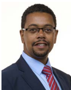
Vaughan Gething AS Y Gweinidog Iechyd a Gwasanaethau Cymdeithasol