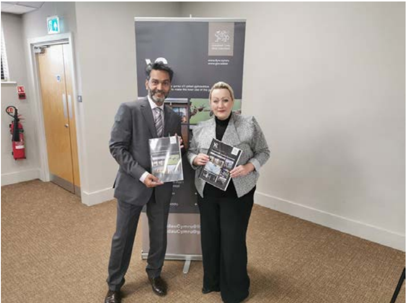
Cadeirydd Umar Hussain MBE gyda Rebecca Evans, AC, y Gweinidog Cyllid a'r Trefnydd gyda'r canllaw ar Drosglwyddo Asedau Cymunedol a dogfen y Pecyn Cymorth Cydweithredol a lanswyd yn y digwyddiad

Disgwylir i gynhadledd flynyddol nesaf Ystadau Cymru gael ei chynnal tua diwedd yr hydref 2020. Ewch i wefan Ystadau Cymru yn rheolaidd i gael y wybodaeth ddiweddaraf am ddyddiad penodedig.