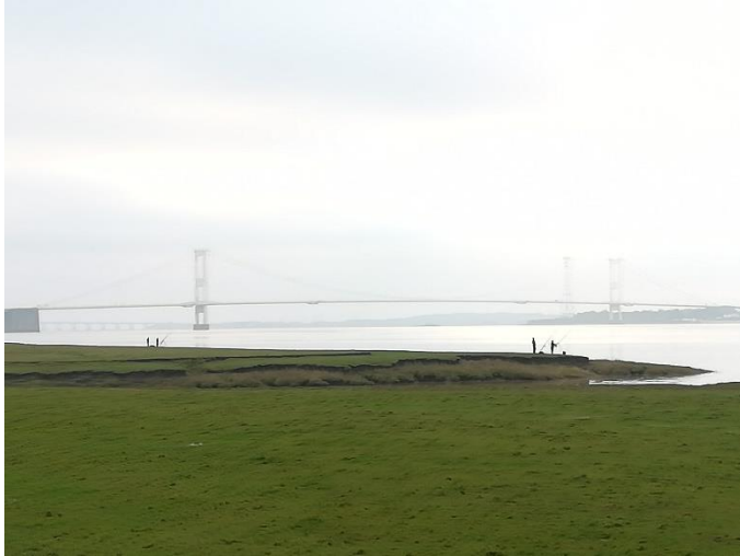
Llun ar y chwith: Genweirio hamdden ar Aber Afon Hafren