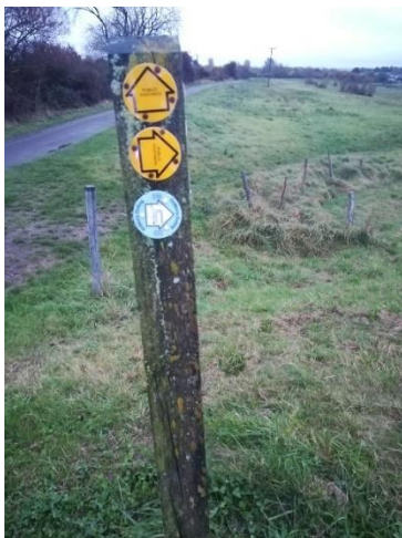
Hawliau tramwy cyhoeddus yn Safle Morol Ewropeaidd Aber Afon Hafren

Morol Ewropeaidd. Mae'n debygol y bydd cam 2 yn cynnwys cwrdd â swyddogion arweiniol ym maes mynediad i'r arfordir a chynnal arolygon safle er mwyn deall pryderon ynghylch lleoliadau penodol a mesurau rheoli sy'n bodoli'n barod. Caiff adroddiad cryno ei lunio erbyn 2022. Bydd y dystiolaeth hon yn dangos a oes angen unrhyw gamau rheoli ar gyfer Awdurdodau Perthnasol.