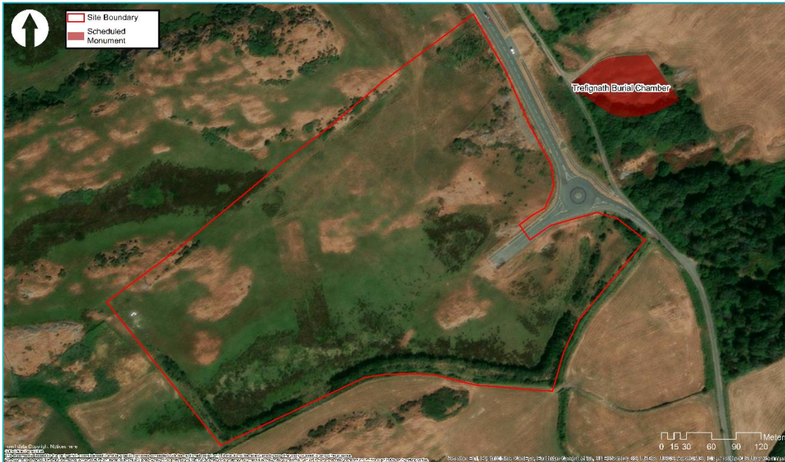
Ffigur 5.1: Siambr Gladdu Trefignath yn berthynol i Ffin Ddangosol y Safle