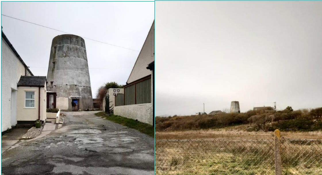
Ffigur 3.5: Melin Wynt Kingsland, yn edrych tua'r dwyrain (chwith) a'r gorllewin (dde)