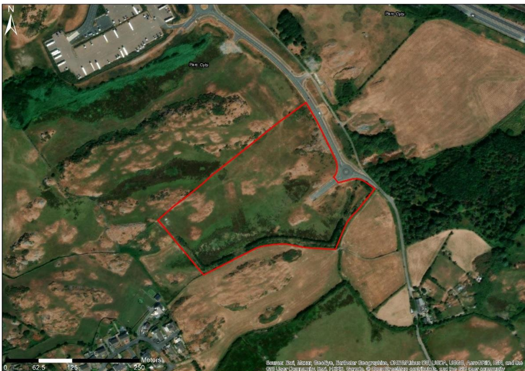
Ffigur 1.1: Ffin Ddangosol y Safle