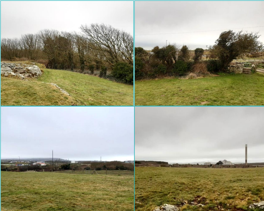
Ffigur 3.2: Lleoliad Siambr Gladdu Trefignath (gyda'r cloc, o'r uchaf ar y chwith: tua'r de, y dwyrain, y gogledd a'r gorllewin)

mae'n rhesymol rhagdybio y gallai ymdeimlad o heddwch ar gyfer myfyrdod o ryw fath fod wedi llunio rhan o'i ddiben. Mae elfennau gwledig y lleoliad, y teimlad o fod wedi'i amgau i'r de ac i'r gorllewin i raddau, a golygfa tuag at Faen Hir Tŷ Mawr a Mynydd Twr yn helpu deall Trefignath a chyfrannu'n gadarnhaol tuag at ei gwerth treftadaeth. Mae lleoliad y beddrod i'w weld isod yn Ffigur 3.2. Sylwch fod y trydydd llun yn llun o'r olygfa tuag at Faen Hir Tŷ Mawr a Mynydd Twr (y mae cwmwl yn ei guddio'n rhannol yma).