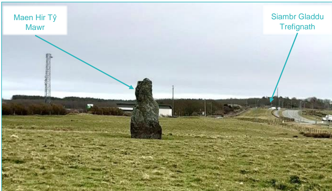
Ffigur 3.3: Yr olygfa o Dŷ Mawr tuag at Drefignath, tua'r dwyrain