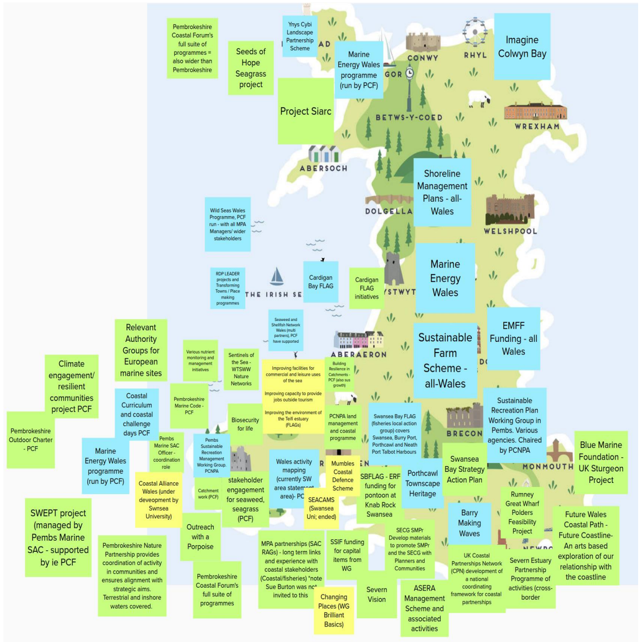
Ffigur 3: Sgrin lun o Ymarfer 1 – Mapio ar gyfer Gweithdy Gogledd Cymru