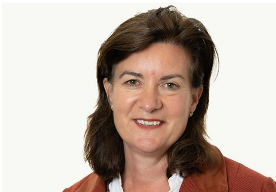
Eluned Morgan AS

Rwy'n credu'n gryf y byddwn ni, drwy dderbyn a gweithredu'r camau hyn, yn gwneud gwahaniaeth aruthrol i fywydau pobl sy'n byw gyda HIV ac i ddiogelu cenedlaethau'r presennol a'r dyfodol rhag y feirws.