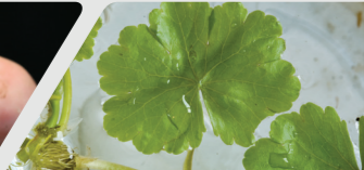
Dail-ceiniog arnofiol Floating pennywort

Gallwch ganfod mwy am blanhigion ac anifeiliaid ymosodol a sut i'w hatal rhag ymledu yn: Find out more about invasive plants and animals and how you can help to stop the spread: