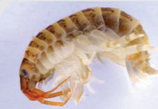
Misglen Quagga Quagga mussel