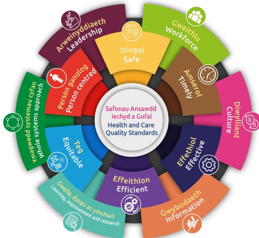
Diagram sy'n dangos y chwe maes ansawdd a ategir gan chwe galluogwr ansawdd. Gyda'i gilydd, maent yn ffurfio'r Safonau Ansawdd Iechyd a Gofal.