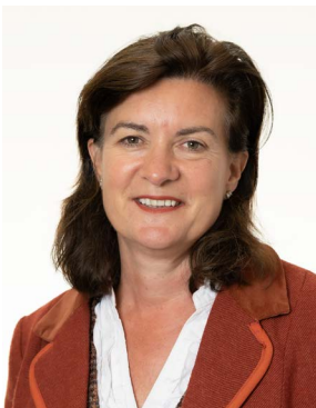
Eluned Morgan AS

Mae'r strategaeth hon yn nodi blaenoriaethau ac amcanion uniongyrchol y Bwrdd Diagnosteg Cenedlaethol a sut y mae'n bwriadu cyflawni yn erbyn yr anghenion presennol hynod heriol, gan gadw golwg ar yr anghenion sydd eto i ddod.