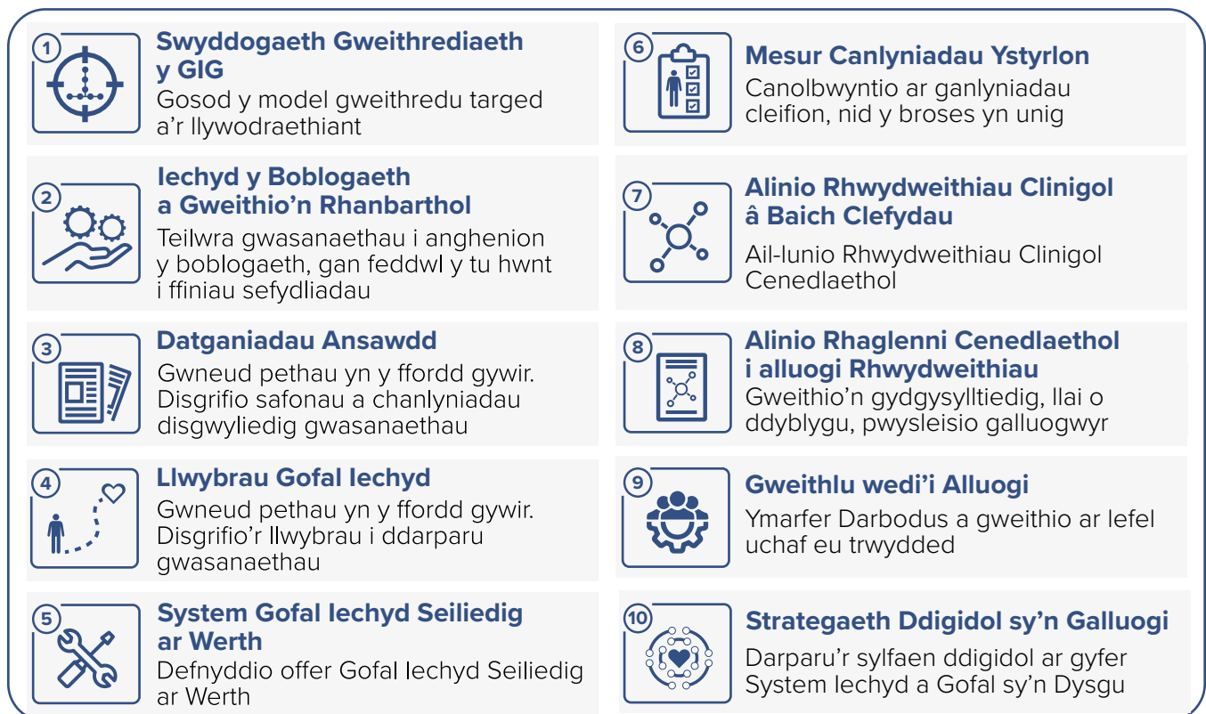
Ffigur 1. Crynodeb o'r camau gweithredu yn y Fframwaith Clinigol Cenedlaethol

Deilliodd y Fframwaith Clinigol Cenedlaethol o Cymru lachach, ac mae wedi'i fabwysiadu fel elfen allweddol o fodel gwaith Gweithrediaeth y GIG. Mae'r Fframwaith yn bwyt cyfeirio ac yn gyfuniad o'r rhan fwyaf o weithredoedd sy'n rhan o Cymru lachach. Mae'r Fframwaith yn disgrifio 'system iechyd a gofal sy'n dysgu' fel y model a fydd yn cyflawni amcanion Cymru lachach, gan ddefnyddio egwyddorion athronyddol Gofal Iechyd Darbodus a pheccynnau cymorth ymarferol Gofal Iechyd Seiliedig ar Werth (ffigur 1). Mae'n seiliedig ar ddata, wedi'i lywio gan dystiolaeth, wedi'i gydgyhyrchu, ac yn canolbwyntio ar gleifion a'r boblogaeth.