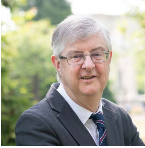
Mark Drakeford AS