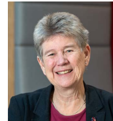
Jane Hutt AS Gweinidog Cyfiawnder Cymdeithasol