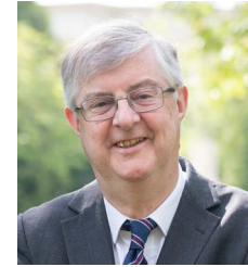
Y Gwir Anrh Mark Drakeford AS Prif Weinidog Cymru

Mae'r Llywodraeth hon yn ymrwymedig i hyrwyddo gwell cydraddoldeb ym mhob agwedd ar ein gwaith ac mae mynd i'r afael â hiliaeth systemig yn flaenoriaeth glir o hyd, gan weithredu mewn modd croestoriadol er mwyn sicrhau y caiff pawb eu cynnwys. Gwyddom mai megis dechrau yw hyn a bod llawer mwy o waith i'w wneud. Er bod yr adroddiad hwn yn canolbwyntio ar ddatblygu prosesau a pholisïau gwrth-hiliol, edrychwn ymlaen at weld adroddiadau yn y dyfodol yn tynnu sylw at ganlyniadau ac effeithiau cadarnhaol parhaus. Rydym yn awyddus inni symud ymlaen ar y daith hon gyda'n gilydd, gan fraenaru'r tir ar gyfer cenedl wrth-hiliol sy'n cydnabod gwerth pawb.