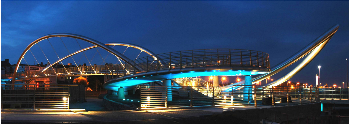
Pont y Porth Celtaidd

Defnyddiwyd £2m o arian yr UE ar gyfer pont Porth Celtaidd Cyngor Sir Ynys Môn gan gysylltu gorsaf drenau Caergybi a therfynfa fferiau â chanol y dref, a gwelwyd gwaith adnewyddu dramatig yn Harbwr y Foryd , yn y Rhyl gyda llithrfa lansio 65 metr newydd, pontynau a waliau cei wedi'u gosod fel rhan o'r gwaith ailddatblygu.