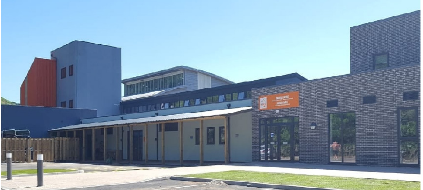
Rock UK Summit Centre, a gefnogir gan y rhaglen Cyrchfannau Denu Twristiaeth

Agorodd Rock UK Summit Centre ym mis Mehefin 2018 yn Nhref Lewis, Merthyr Tudful, a hwn oedd y prosiect cyntaf i gael ei gwblhau o dan raglen Cyrchfannau Denu Twristiaeth Llywodraeth Cymru gydag arian yr UE. Mae'r hen lofa wedi cael ei thrawsnewid yn lleoliad unigryw sy'n cynnig llety en-suite sy'n darparu popeth, ystafelloedd cyfarfod, canolfan ddringo dan do, caffi a man chwarae i blant yn yr awyr agored, ystafell ffirwydd a champfa. Mae'r Summit Centre, a gafodd £2.3m o gyllid yr UE, yn cynnig dros 20 o weithgareddau dan gyfarwyddyd hyfforddwy, ac mae ei lleoliad gwledig yn cynnig nifer o weithgareddau oddi ar y safle gan gynnwys dringo ar greigiau lleol, cerdded ceunentydd drwy raeadrau naturiol, crwydro ogofâu, canwio, ceufadu a gweithgareddau rhyfelwyr eco.