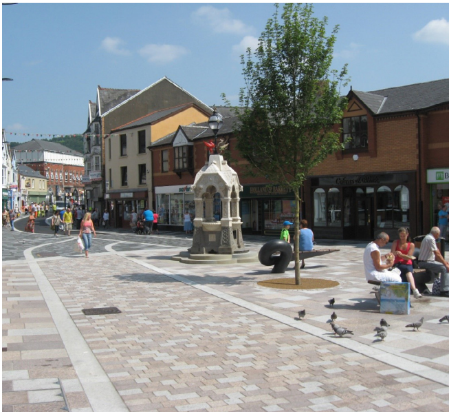
Sgwâr Penuel, Pontypridd

Yn rhaglen 2007-2013, buddsoddwyd llawer iawn o arian yr UE i uwchraddio ac adfywio llawer o ganol trefi ledled Cymru. Ochr yn ochr ag adfywio Sgwâr Penuel yng nghanol tref Pontypridd , mae'r gwaith o adfer Lido gwreiddiol Parc Ynysangharad , adeilad rhestredig Gradd II o'r 1920au, yn atyniad rhanbarthol i ymwelwyr, wedi darparu cyfleuster hynod boblogaidd sy'n denu miloedd o ymwelwyr bob blwyddyn. Mae hyn wedi adfywio a gwarchod rhan bwysig o'r dreftadaeth leol, gan ei drawsnewid yn ased economaidd o bwys mawr i ffyniant Pontypridd.