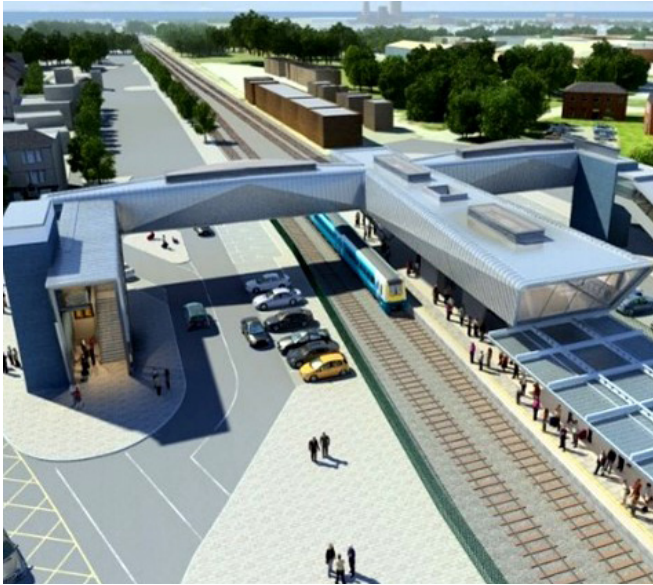
Cyfnewidfa Trafnidiaeth Cwadrant

Mae seilwaith trafniadaeth ledled y rhanbarth wedi gweld manteision buddsoddiadau ag arian yr UE gyda'r cynllun Cyfnewidfa Trafnidiaeth Cwadrant yn Abertawe yn arwain at ddisodli'r orsaf fysiau hen ffasiwn, a oedd wedi gweld dyddiau gwell, gyda Chyfnewidfa Drafnidiaeth fodern o ansawdd uchel ar gyfer bysiau a bysiau moethus yn ogystal â darparu unedau manwerthu ar y safle a chyfleusterau swyddfa.