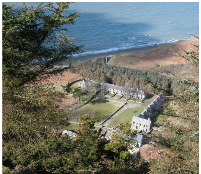
Canolfan Iaith a Threftadaeth Cymru, Nant Gwrtheyrn

Yn 1982, prynodd grŵp cymunedol bentref chwarel gwag ac anghysbell Nant Gwrtheyrn , gan adnewyddu'r adeiladau a dechrau eu hysgol eu hunain i ddysgu'r Gymraeg. Gyda £3.3m o gyllid yr UE, llwyddwyd i adeiladu ffordd fynediad newydd, ystafelloedd addysgu a digwyddiadau pwrpasol, llety i ymwelwyr, caffi, siop a chanolfan dreftadaeth am hanes lleol, ynghyd â hanes yr iaith Gymraeg. Gyda'r strwythur hygyrch newydd hwn, mae Canolfan Iaith a Threftadaeth Cymru yn atyniad arwyddocaol, gyda dros 120,000 o ddysgwyr, twristiaid ac ymwelwyr digwyddiadau yng Nghymru bob blwyddyn. Mae'n rhoi cyfle i'r pentref ddod â busnes ychwanegol i'r ardal anghysbell, gan ddod yn gynaliadwy yn ariannol a chreu cyflogaeth drwy gydol y flwyddyn. Yn 2018, enillodd Nant Gwrtheyrn Wobr fawreddog RegioStars yr UE am 'Fuddsoddi mewn Treftadaeth Ddiwylliannol'. Mae'r gwobrau'n nodi ac yn rhoi cyhoeddusrwydd i'r prosiectau arloesol rhanbarthol da, ar draws gwahanol gategorïau ac yn hyrwyddo cyfnewid arferion da ledled Ewrop.