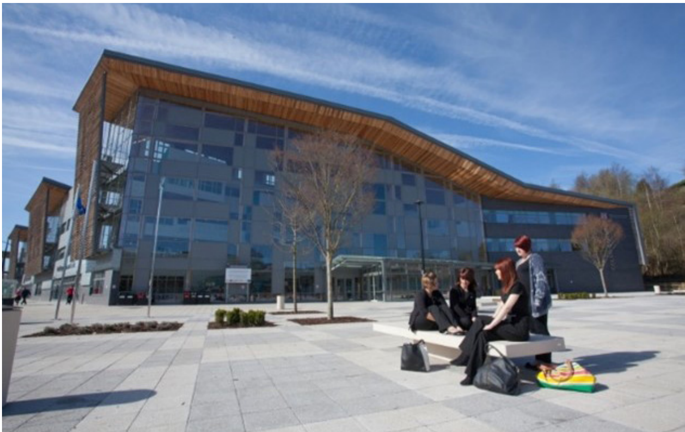
Parth Dysgu Blaenau Gwent

Mae addysg ym Mlaenau Gwent wedi cael ei thrawsnewid drwy Parth Dysgu Blaenau Gwent , o'r radd flaenaf, sy'n werth £33.5m. Agorwyd y parth yn 2012 gyda chymorth £8m o gyllid yr UE. Mae'r Parth Dysgu yn helpu i wella deilliannau addysgol pob dysgwr – drwy bynciau Safon Uwch a chyrtsiau galwedigaethol ar gyfer ystod eang o ddiwydiannau.