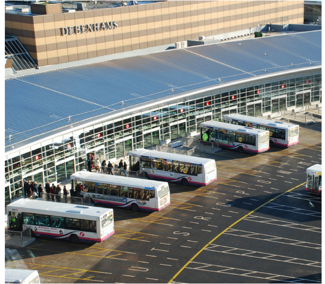
Gorsaf Fysiau Abertawe

Gan sicrhau gwelliant gweledol yr oedd mawr ei angen, defnyddiwyd £20m o gyllid yr UE yn Rhaglen 2007-2013 i gefnogi'r gwaith cynhwysfawr o adfywio a chreu Canol Dinas y Glannau bywiog, deniadol a chynaliadwy yn Abertawe gyda £3.7m o gyllid yr UE yn helpu i adeiladu Amgueddfa Genedlaethol y Glannau yn Abertawe gan adrodd hanes diwydiant ac arloesi yng Nghymru dros y 300 mlynedd diwethaf.