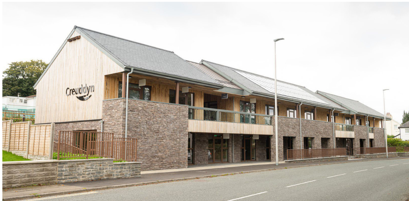
Adeilad y Creuddyn

Roedd Canolfan Fenter Dulais neu Creuddyn fel y'i gelwir erbyn hyn, yn brosiect a ariennir gan yr UE dan arweiniad Barcud i ailddatblygu safle mewn cyflwr gwael, ond a oedd yn gartref i sawl elusen a busnes bach a phob un yn cyfrannu at economi'r dref leol. Erbyn hyn, mae'r cyfleuster newydd yn darparu unedau busnes modern o ansawdd uchel ar gyfer y sefydliadau hyn ac ystafell gynadledda / hyfforddi boblogaidd i'w llogi.