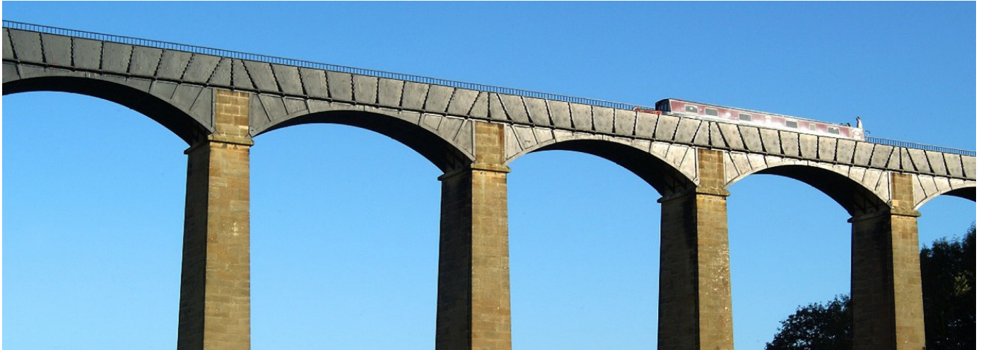
Traphont Ddŵr a Chamlas Pontcysyllte

Wedi'i ddynodi'n Safle Treftadaeth y Byd yn 2009, cafodd Traphont Ddŵr a Chamlas Pontcysyllte yn Wrecsam ei hadfer gan Ddyfrffyrdd Prydain gyda chymorth £700k o gyllid yr UE. Cafodd ei hadeiladu'n wreiddiol rhwng 1795 a 1808 gan ddau ffigur pwysig yn natblygiad peirianeg sifil, Thomas Telford a William Jessop. Mae'r gamlas yn croesi dau brif ddyffryn afon, a dyma'r draphont ddŵr uchaf a hwyaf ym Mhrydain. Erbyn hyn, mae'n hwb twristiaeth ac economaidd mawr i'r ardal leol gyda mwy na 10,000 o gychod a degau o filoedd o ymwelwyr yn ei chroesi bob blwyddyn.