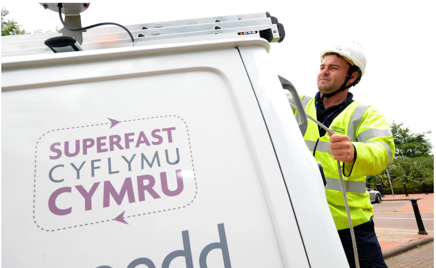
Prosiect Band Eang y Genhedlaeth Nesaf

Fe wnaeth rhaglen Band Eang y Genhedlaeth Nesaf barhau â nod cynllun Band eang cyflym iawn 2007-2013 ac roedd yn rhan o'r gwaith o ddarparu ar hyd a lled Cymru. Gwelwyd cynnydd yn nifer yr aelwydydd a busnesau yng Nghymru a oedd yn defnyddio band eang cyflym iawn a gwibgyswllt, gyda dros 126,000 o adeiladau a dros 1,200 o fentrau'n cael cymorth.