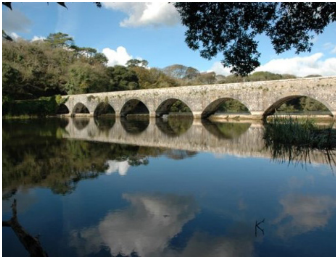
Pont Ystaganbwll, diolch i: Mike May

Cafodd Aiddarganfod Ystaganbwll , un o brosiectau'r Ymddiriedolaeth Genedlaethol, £1.6m o gyllid yr UE i drawsnewid y safle yn ne Sir Benfro, drwy adnewyddu'r Ganolfan Dysgu yn yr Awyr Agored a'r chyfleusterau llety. Gan ddenu diddordeb sylweddol gan ysgolion a grwpiau prifysgol ar gyfer teithiau maes, mae'r Ganolfan Dysgu yn yr Awyr Agored hefyd yn cynnig ystod eang o gysiau, o ffotograffiaeth dan y dŵr a thirwedd i seryddiaeth, sgiliau byw yn y gwylt, theatr awyr agored dull Shakespeare a bywyd gwylt. Mae'r ystâd yn cael ei chydnabod yn genedlaethol ac yn rhyngwladol am bwysigrwydd ei nodweddion, ac mae'n chwarae rhan bwysig yn economi twristiaeth ranbarthol Sir Benfro.