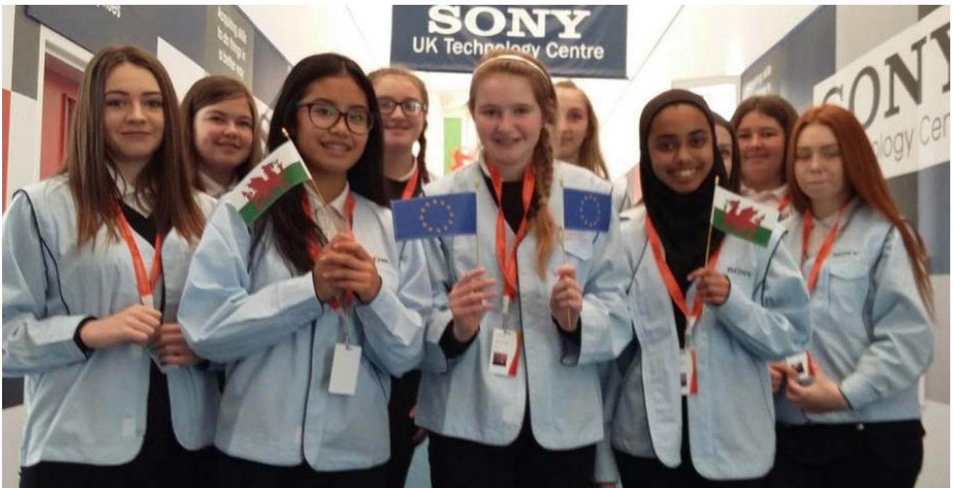
Cyfranogwyr prosiect STEM Cymru 2

Mae STEM Cymru 2 dan arweiniad Cynllun Addysg Beirianeg Cymru (EESW), wedi cefnogi dros 15,609 o bobl ifanc rhwng 11 a 19 oed i gyfranogi mwy mewn pynciau STEM, gyda 54% ohonynt yn ferched. Gan weithio mewn timau prosiect, roedd pobl ifanc yn mynd i'r afael â phroblemau peirianeg ac yn datblygu'r sgiliau allweddol y mae cyflogwyr yn gofyn amdanynt. Yn y chweched dosbarth, gweithiodd timau gyda mentoriaid diwydiannol i ddatblygu atebion ymarferol i heriau a wynebir gan gwmnïau cyswllt, gyda rhai atebion yn cael eu mabwysiadu a'u rhoi ar waith gan y cwmnïau hynny.