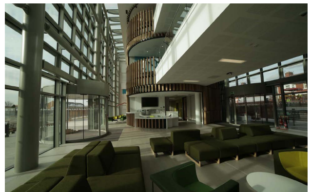
Tu mewn i CUBRIC

Roedd prosiect CUBRIC II , dan arweiniad Prifysgol Caerdydd, wedi integreiddio elfennau o'r themâu trawsbynciol yn systematig i'w ddylunio. Llwyddodd yr adeilad i ennill statws BREEAM 'rhagorol' gan ymgorffori amrywiaeth o fesurau effeithlonrwydd adnoddau gan gynnwys tri tho gwyrdd, ac mae wedi ennill llu o wobrau. Yn 2016, cafodd Wobr Efydd Cynaliadwyedd Amgylcheddol, ac yn 2017, llwyddodd i ennill gwobr Categori Adeilad Ymchwil Gwyddor Bywyd yng Ngwobrau S-Lab 2017. Enillodd hefyd Wobr Arbennig y Cadeirydd ar gyfer Adeiladu Arbenigrwydd yng Nghymru a Phrosiect y Flwyddyn a'r teitl Dylunio drwy Arloesi yng Ngwobrau RICS 2017, Cymru. Yn 2018 dyfarnwyd gwobr Arian i'r adeilad am y Cynllun Effaith Gwyrdd.