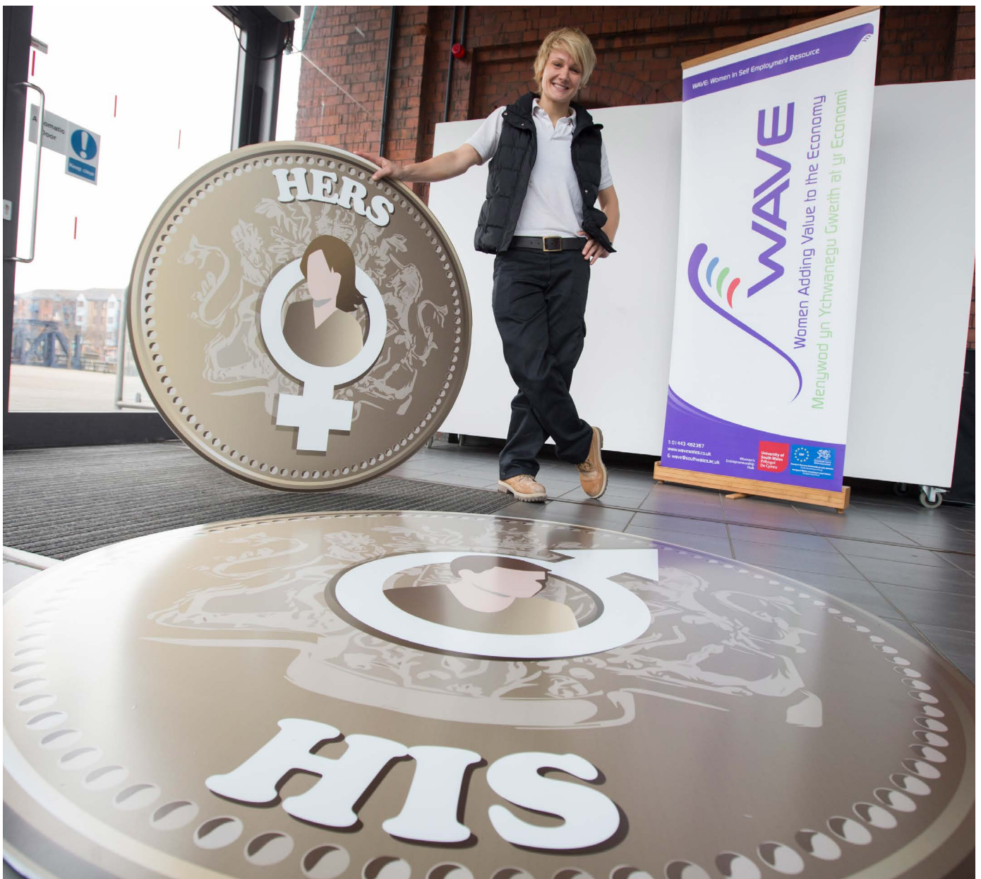
Cyfranogwr Menywod sy'n Ychwanegu Gwerth at yr Economi (WAVE)

Ar ôl cael dadansoddiad gan y prosiect, arweiniodd hyn at sefydlu'r Rhwydwaith Cyflogaeth a Chyflog Dynion a Menywod (GEPN) a llunio Baromedr Cyflog Cyfartal. Dyma adnodd chwilio ar-lein sy'n dangos y swyddi y mae dynion a menywod yn eu gwneud yng Nghymru, eu patrymau gwaith, cyfartaledd cyflogau, a bylchau cyflog.