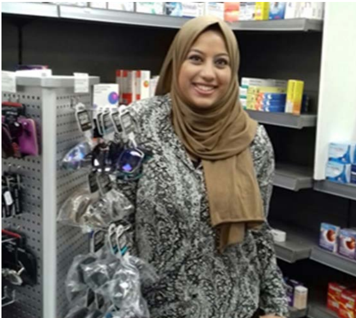
Cyfranogwr GO Wales: Prosiect cyflawni drwy Brofiad Gwaith

Roedd GO Wales: Cyflawni drwy Brofiad Gwaith yn gweithredu ledled Cymru, dan arweiniad Cyngor Cyllido Addysg Uwch Cymru (CCAUC), ac yn cefnogi dros 1800 o fyfyrwyr mewn addysg uwch a oedd mewn perygl o fod yn NEET (Ddim mewn Cyflogaeth, Addysg neu Hyfforddiant), gan ddod o hyd i gyflogwyr addas a chyfleoedd profiad gwaith iddynt ddatblygu eu sgiliau a'u hyder, a gwella eu cyflogadwyedd. Llwyddodd y prosiect i ymgysylltu a chefnogi myfyrwyr a oedd yn wynebu rhwystrau penodol, gyda 26% o gyfranogwyr o gefndir du, Asiaidd neu leiafrif ethnig a 70% yn nodi eu bod yn anabl neu fod ganddynt Gyflwr Iechyd sy'n Cyfyngu ar Waith (WLHC) gan gynnwys Anhwylder ar y Sbectwm Awtistiaeth a chyflwr iechyd meddwl.