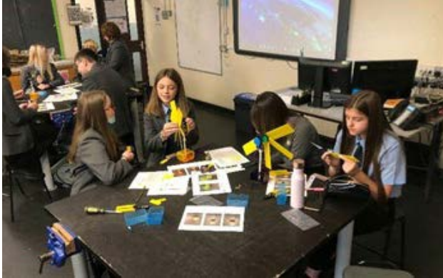
Prosiect STEM Cymru 2 Cynllun Addysg Beirianeg Cymru (EESW)

Mae cyllid yr UE wedi bod yn hanfodol hefyd i gefnogi a hwyluso amrywiaeth o fentrau i sicrhau newid sylweddol o ran goresgyn y bwlch rhwng y rhywiau mewn pynciau sy'n ymwneud â Gwyddoniaeth, Technoleg, Peirianeg a Mathemateg (STEM). Mae prosiectau STEM fel STEM Gogledd , STEM Cymru 2 a Technocamps 2 wedi rhoi cyfle i ddisgyblion gymryd rhan mewn gweithdai i adeiladu ar eu gwybodaeth bresennol am TG a chyfrifiadura, ac mae prosiect Trio Sci Cymru wedi annog pobl ifanc, yn enwedig merched, i astudio pynciau STEM yn yr ysgol ac ystyried gyrfa yn y meysydd hynny.