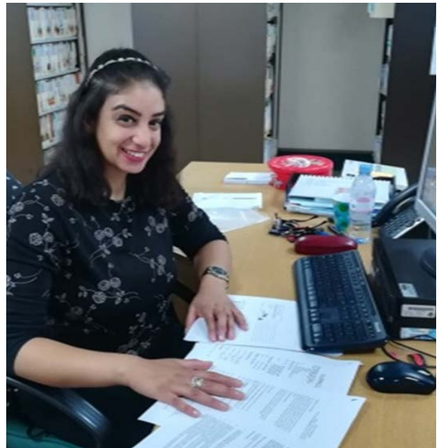
Cyfranogwr GO Wales: Prosiect cyflawni drwy Brofiad Gwaith

Roedd y Gwasanaeth Di-waith–Cymru Iach ar Waith (16-24 oed) , a reolir gan Adran Iechyd a Gwasanaethau Cymdeithasol Llywodraeth Cymru, yn gweithio gyda phobl ifanc nad oeddent mewn addysg na hyfforddiant a bod camddefnyddio sylweddau a/neu broblemau iechyd meddwl yn effeithio arnynt. Roedd y prosiect yn eu cefnogi i fynd yn ôl i fyd addysg, hyfforddiant neu gyflogaeth, i helpu i leihau tlodi ac allgáu cymdeithasol. Roedd llawer yn wynebu rhwystrau ychwanegol, a oedd yn cynnwys bod yn rhan o'r system gyfiawnder, cyrhaeddiad addysgol isel mewn sawl achos, ansicrwydd o ran tai, diffyg gofal plant a chlundant, dim mynediad at gymorth ariannol, diffyg dealltwriaeth o ddewisiadau a chyfleoedd sydd ar gael iddynt ym maes addysg, hyfforddiant a chyflogaeth.