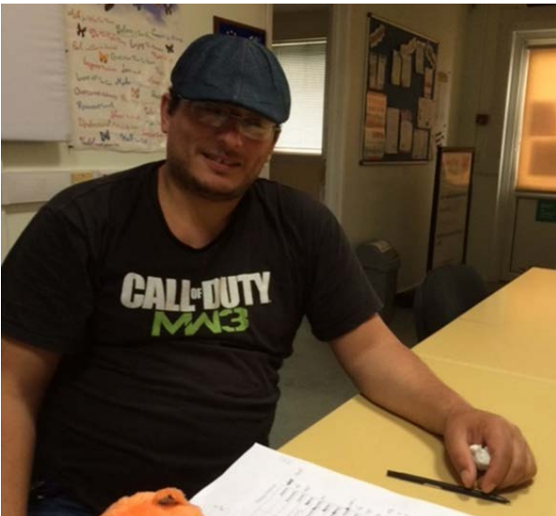
Cyfranogwr prosiect Sicrhau Newid trwy Gyflogaeth (ACE)

Gan ddeall y cymhlethdodau sy'n gysylltiedig ag ymgysylltu, a'r amheuon sydd gan rai cymunedau ynghylch darpariaeth prif ffrwd, roedd y prosiect Sicrhau Newid trwy Gyflogaeth (ACE) a ddarparwyd gan CGL Ltd, yn cefnogi unigolion du, Asiaidd ac ethnig lleiafrifol a mudwyr i oresgyn y rhwystrau cymhleth sy'n aml yn eu hwynebu yn y farchnad gyflogaeth yng Nghymru. Gan adeiladu ar lwyddiant y prosiect Cynyddu Cyflogaeth i Bobl Dduon, Asiaidd a Lleiafrifoedd Ethnig a Mynd i'r Afael ag Anweithgarwch Economaidd o'r rhaglen 2007-2013, roedd cronfa o wirfoddolwyr yn cynnig mentora un-i-un, helpu gyda meithrin hyder, sgiliau a gwybodaeth, cyfleoedd gwirfoddoli a phrofiad gwaith. Roedd y prosiect hefyd yn cynnig pecyn e-ddysgu 'Saesneg Cyflym' i helpu'r cyfranogwyr hynny sydd â gallu isel yn yr iaith Saesneg.