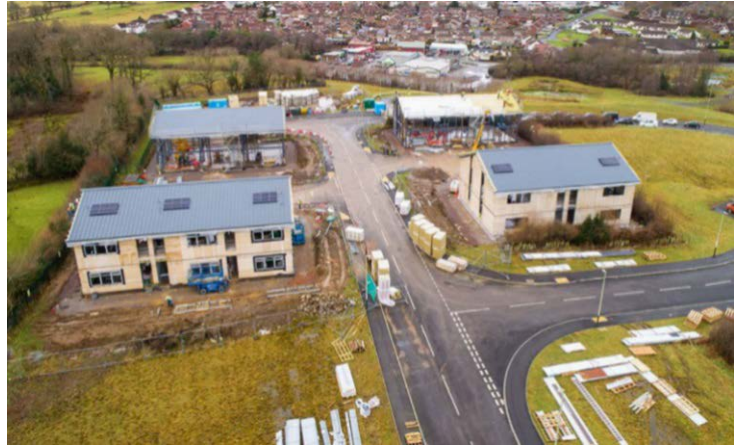
Safle Strategol Tŷ Du

Ceir rhai enghreifftiau clir o brosiectau a ariennir drwy'r Cronfeydd Strwythurol, lle mae'r ffofws ar yr amgylchedd wedi'i ategu drwy godi ymwybyddiaeth, meithrin sgiliau yn y gymuned, a chynnig cyfleoedd i unigolion a grwpiau a allai fel arall fod wedi cael eu heithrio rhag cymryd rhan.