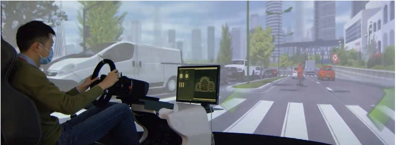
Rhith Lab IROHMS, Prifysgol Caerdydd

Mae llawer o brosiectau eraill a ariennir gan yr UE wedi bod yn gweithio gydag ysgolion a cholegau, ar yr agenda STEM gan gynnwys y Ganolfan Deallusrwydd Artiffisial, Roboteg a Systemau Peiriant-Dynol (IROHMS) , canolfan dechnoleg aml-ddisgyblaeth ym Mhrifysgol Caerdydd. Mae'r prosiect yn targedu cyfleoedd newydd gan Ddeallusrwydd Artiffisial (AI) a Roboteg a Systemau Peiriant-Dynol (HMS). Mae IROHMS wedi datblygu ymrwymiad cadarn Prifysgol Caerdydd i gefnogi cyfranogiad menywod mewn STEM, ac mae aelodau tîm wedi gweithio hefyd mewn partneriaeth â chynlluniau eraill Prifysgol Caerdydd a phrosiectau a ariennir gan yr UE, fel FLEXIS , i gydlynu a darparu gweithgareddau, cefnogi ehangu mynediad a gwella gweithgareddau STEM mewn ysgolion.