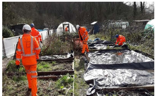
Tîm Trafnidiaeth Cymru yn Rhandiroedd Ffynnon Taf

Mae prosiect Metro De Cymru yn cael ei arwain gan Trafnidiaeth Cymru, sydd, ynghyd â'u contractwyr, wedi bod yn cymryd rhan mewn gwaith allgymorth cymunedol ledled Cymru. Mae naw safle'n cael eu gwella i baratoi ar gyfer trydaneiddio ac mae pob un yn elwa o gynlluniau gweithredu cymunedol. Dyma rai enghreifftiau: Cydweithiodd Griffiths Construction a Thrafnidiaeth Cymru ar adnewyddu a gwella hygyrchedd gofod rhandir yn Ffynnon Taf a oedd wedi mynd yn flêr ac wedi gordyfu.