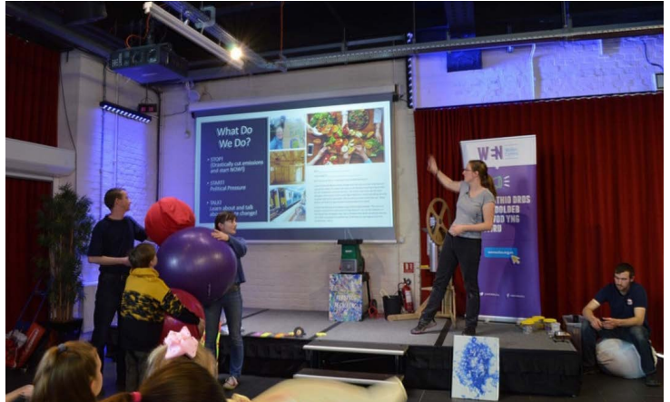
Prosiect RICE – Gwyddoniaeth Super Abertawe 2020

Ledled Cymru, fel rhan o'r ymrwymiad i ddwyn budd i gymunedau drwy gyllid Ewropeaidd, mae prosiectau wedi bod yn darparu gweithgareddau sy'n cyfrannu at gydraddoldeb mynediad, yn diogelu ac yn gwella'r amgylchedd naturiol ac yn annog cydlyniant ac ymgysylltiad cymdeithasol. Mae gweithgareddau er budd y gymuned yn cynnwys darparu cyflogaeth leol, hyfforddiant, prentisiaethau a chynlluniau lleoliadau gwaith; cynlluniau gwirfoddoli; gweithio gydag elusennau lleol, gwella'r amgylchedd naturiol ac amgylchedd adeiledig, a noddi cynlluniau a rhoddion.