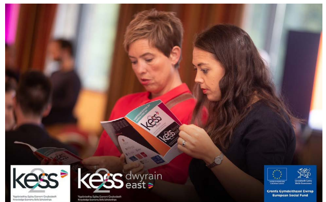
Ysgoloriaethau Sgiliau'r Economi Wybodaeth 2 (KESS 2)