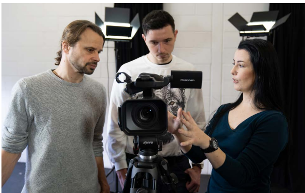
Prosiect Cynhyrchu Cyfryngau Uwch

Roedd Trac 11-24 dan arweiniad Cyngor Sir Ddinbych, yn darparu cyfleoedd drwy gyfrwng y Gymraeg, ac fel rhan o'r broses gaffael, cafodd digwyddiad penodol cwrdd â'r prynwr ei gynnal drwy gyfrwng y Gymraeg. Llwyddodd Cynhyrchu Cyfryngau Uwch , dan arweiniad Prifysgol Aberystwyth, i ddarparu llawer o'i fodiwlau yn y Gymraeg. Dywedodd un cyfranogwr 'fel siaradwr Cymraeg iaith gyntaf, roedd yn wych gallu astudio'r rhan fwyaf o'r modiwlau drwy gyfrwng y Gymraeg'.