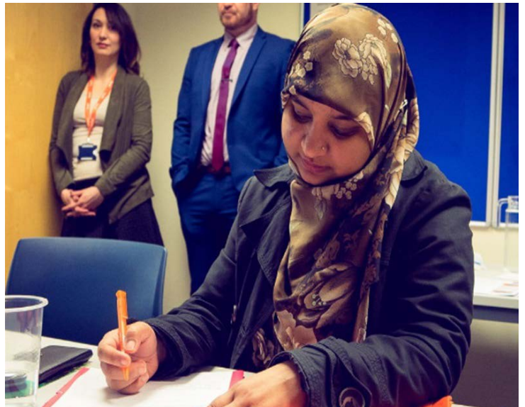
Cyfranogwr prosiect Sicrhau Newid trwy Gyflogaeth (ACE)