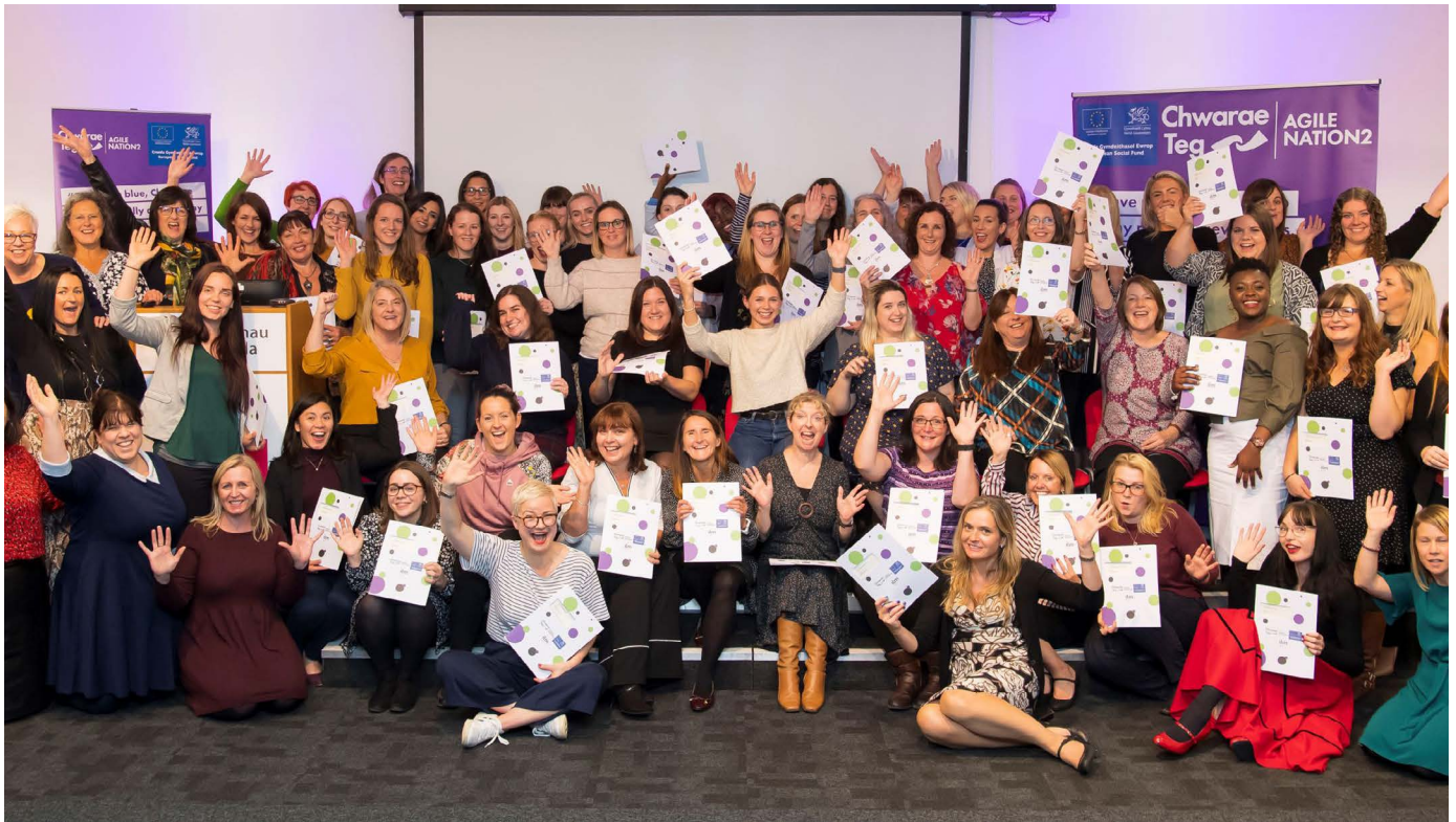
Cyfranogwyr prosiect Cenedl Hyblyg 2 Chwarae Teg

Ers 2007, mae Cenedl Hyblyg a'i brosiect olynol Cenedl Hyblyg 2 , dan arweiniad Chwarae Teg, wedi hyrwyddo cydraddoldeb rhwng y rhywiau a chefnogi datblygiad gyrfaoedd ar gyfer menywod drwy roi cefnogaeth benodol i weithwyr yn ogystal â gweithio gyda chyflogwyr ar welliannau mewn Strategaethau Cydraddoldeb ac Amrywiaeth. Cyflwynodd y prosiect ddwy elfen ledled Cymru, gan gefnogi bron i 7,000 o fenywod i ddilyn cymwysterau arwain a chael eu mentora i wella eu safle yn y gweithlu. Ymgysylltwyd â dros 1,260 o gyflogwyr gan eu cefnogi i fynd i'r afael ag anafteision o ran rhywedd yn y gweithlu a hyrwyddo arferion gweithio modern ac amrywiaeth.