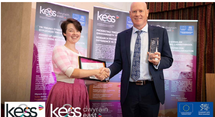
Ysgoloriaethau Sgiliau'r Economi Wybodaeth 2 (KESS 2) Enillydd Gwobr

Mae Datblygu Cynaliadwy wedi chwarae rhan allweddol hefyd yn y prosiectau cyfalaf sydd wedi'u hariannu, yn enwedig o ran meithrin dulliau arloesi. Ceir rhai enghreifftiau rhagorol sy'n cynnwys toeau gwyrdd, waliau byw, elfennau bioamrywiaeth a mesurau effeithlonrwydd adnoddau.