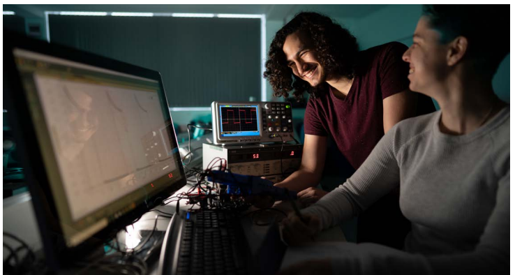
Prosiect Cynhyrchu Cyfryngau Uwch

Rhoddodd Cymorth yn y Gwaith Cymru Iach ar Waith , dan arweiniad Adran Iechyd a Gwasanaethau Cymdeithasol Llywodraeth Cymru, gyfranogwr Cymraeg ei iaith gyda chydlynnydd achosion Cymraeg ei iaith i'w cynorthwyo drwy eu sesiynau ffisiotherapi.