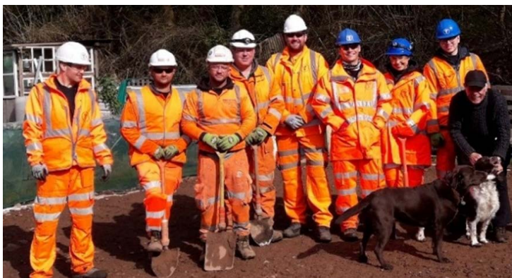
Tîm Trafnidiaeth Cymru yn Rhandiroedd Ffynnon Taf

Ledled Cymru, fel rhan o'r ymrwymiad i ddwyn budd i gymunedau drwy gyllid Ewropeaidd, mae prosiectau wedi bod yn darparu gweithgareddau sy'n cyfrannu at gydraddoldeb mynediad, yn diogelu ac yn gwella'r amgylchedd naturiol ac yn annog cydlyniant ac ymgysylltiad cymdeithasol. Mae gweithgareddau er budd y gymuned yn cynnwys darparu cyflogaeth leol, hyfforddiant, prentisiaethau a chynlluniau lleoliadau gwaith; cynlluniau gwirfoddoli; gweithio gydag elusennau lleol, gwella'r amgylchedd naturiol ac amgylchedd adeiledig, a noddi cynlluniau a rhoddion.