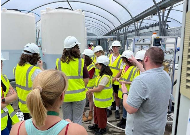
Twnelau polythen Lleihau Allyriadau Carbon Diwydiannol (RICE)

Roedd Lleihau Allyriadau Carbon Diwydiannol (RICE) dan arweiniad Prifysgol Abertawe mewn partneriaeth â Phrifysgol De Cymru, wedi canolbwyntio ar brosesau arloesol i leihau allyriadau CO2 Cymru a lleihau'r defnydd o ynni a deunydd crai gan Ddiwydiant Trwm yng Nghymru. Llwyddodd tîm RICE i ymgorffori canlyniadau cydraddoldeb mewn prosiect sy'n ymwneud yn bennaf â'r amgylchedd, gan gefnogi mwy o ferched a menywod ifanc i gymryd rhan mewn STEM a chydabod pwysigrwydd tîm prosiect amrywiol o ran arloesi a syniadau.