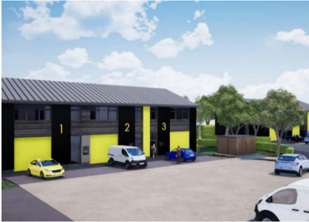
Safle Strategol Tŷ Du

Mae Safle Strategol Tŷ Du yn gydweithrediad rhwng Gwasanaeth Cynllunio ac Adfywio Cyngor Bwrdeistref Sirol Caerffili a Llywodraeth Cymru i adeiladu 4 adeilad cyflogaeth o ansawdd uchel. Bydd yr adeilad busnes newydd yn cynnwys gofod gweithredol helaeth, lle parcio i geir a beiciau, seddi allanol ac ardaloedd i grwpiau mewn lleoliad wedi'i dirlunio'n ddeniadol, gan gynnwys coed a gwrychoedd newydd. Mae celloedd PV solar a mesurau effeithlonrwydd dŵr wedi cael eu defnyddio. Gan gefnogi seilwaith gwyrdd a bioamrywiaeth, bydd Cynllun Rheoli Tirwedd 25 mlynedd o hyd yn cynnwys gwarchod gwrychoedd ffiniau ochr yn ochr â phlannu coed newydd a phlannu planhigion drwy gydol y flwyddyn er budd rhywogaethau sy'n peillio.