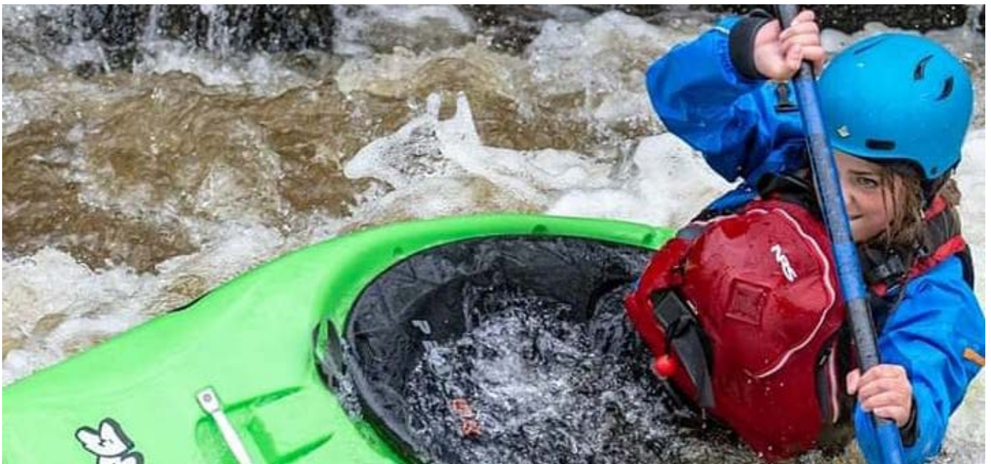
ADTRAC yn cefnogi pobl ifanc ledled gogledd Cymru

Ar draws gogledd Cymru, roedd ADTRAC , dan arweiniad Grŵp Llandrillo Menai, yn darparu cymorth lles a chyflogadwyedd wedi'i bersonoli i bron 1,200 o bobl ifanc, llawer ohonynt ag anableddau cymhleth. Cynigiodd timau ADTRAC wasanaeth mentora pwrpasol i helpu pobl ifanc i ddatblygu cynlluniau gweithredu personol i wella eu lles meddyliol a'u cyflogadwyedd, ennill cymwysterau neu fynd i addysg, hyfforddiant neu gyflogaeth.