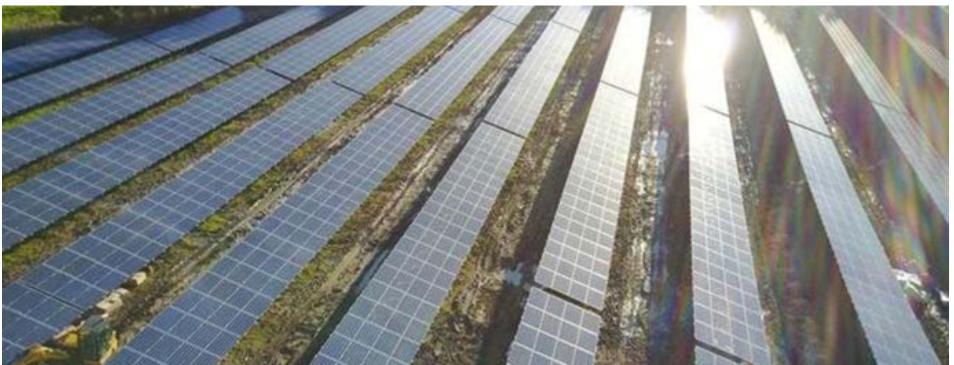
Prosiect Swansea Community Solar Storage, Gower Power

Mae gweithio mewn partneriaeth wedi bod yn allweddol i lwyddiant Swansea Community Solar Storage dan arweiniad Gower Power. Gan ymgysylltu â grwpiau cymunedol lleol i feithrin sgiliau a hyder aelodau'r gymuned, mae'r prosiect wedi rhoi cefnogaeth i'r rhai sydd fwyaf ei hangen i fabwysiadu mesurau arbed ynni yn eu cartrefi i liniaru tlodi tanwydd. Mae hefyd yn gweithio gyda'r gymuned i godi ymwybyddiaeth a dealltwriaeth o faterion ynni sy'n gysylltiedig â newid yn yr hinsawdd.