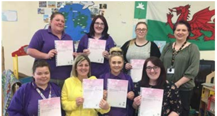
Cyfranogwyr Sgiliau Gwaith i Oedolion 2

Roedd Trac 11-24 dan arweiniad Cyngor Sir Ddinbych, yn darparu cyfleoedd drwy gyfrwng y Gymraeg, ac fel rhan o'r broses gaffael, cafodd digwyddiad penodol cwrdd â'r prynwr ei gynnal drwy gyfrwng y Gymraeg. Llwyddodd Cynhyrchu Cyfryngau Uwch , dan arweiniad Prifysgol Aberystwyth, i ddarparu llawer o'i fodiwlau yn y Gymraeg. Dywedodd un cyfranogwr 'fel siaradwr Cymraeg iaith gyntaf, roedd yn wych gallu astudio'r rhan fwyaf o'r modiwlau drwy gyfrwng y Gymraeg'.