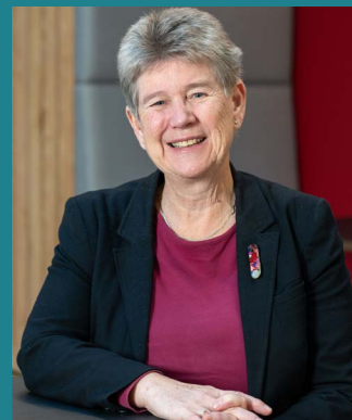
Jane Hutt AS

Ni ddylid tanbriso maint yr her a wynebwn, a rhaid i'n hymdrechion ar y cyd barhau i ganolbwyntio ar fuddiannau'r genhedlaeth bresennol o blant a phobl ifanc, yn ogystal â chenedlaethau'r dyfodol. Dim ond drwy drefniadau gweithio cadarn ar draws y llywodraeth i gefnogi cydweithio effeithiol ar lefelau rhanbarthol a lleol y gallwn weithio gyda'n gilydd i sicrhau bod pob plentyn a pherson ifanc yng Nghymru yn gallu arfer ei hawlau.