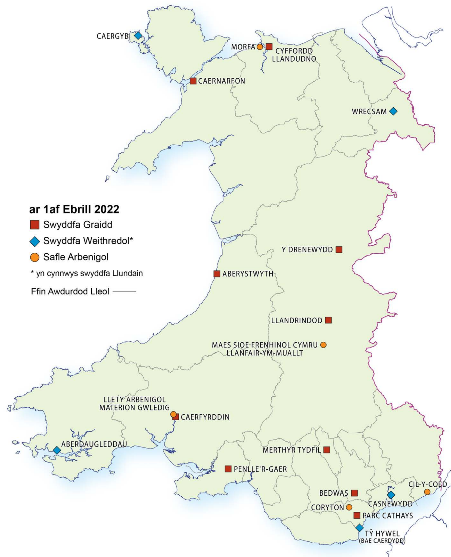
Ffigur 1: Lleoliad swyddfeydd craidd Llywodraeth Cymru