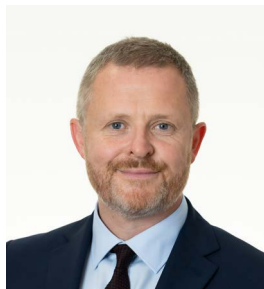
Jeremy Miles AS

Y Dirprwy Weinidog Gwasanaethau Cymdeithasol