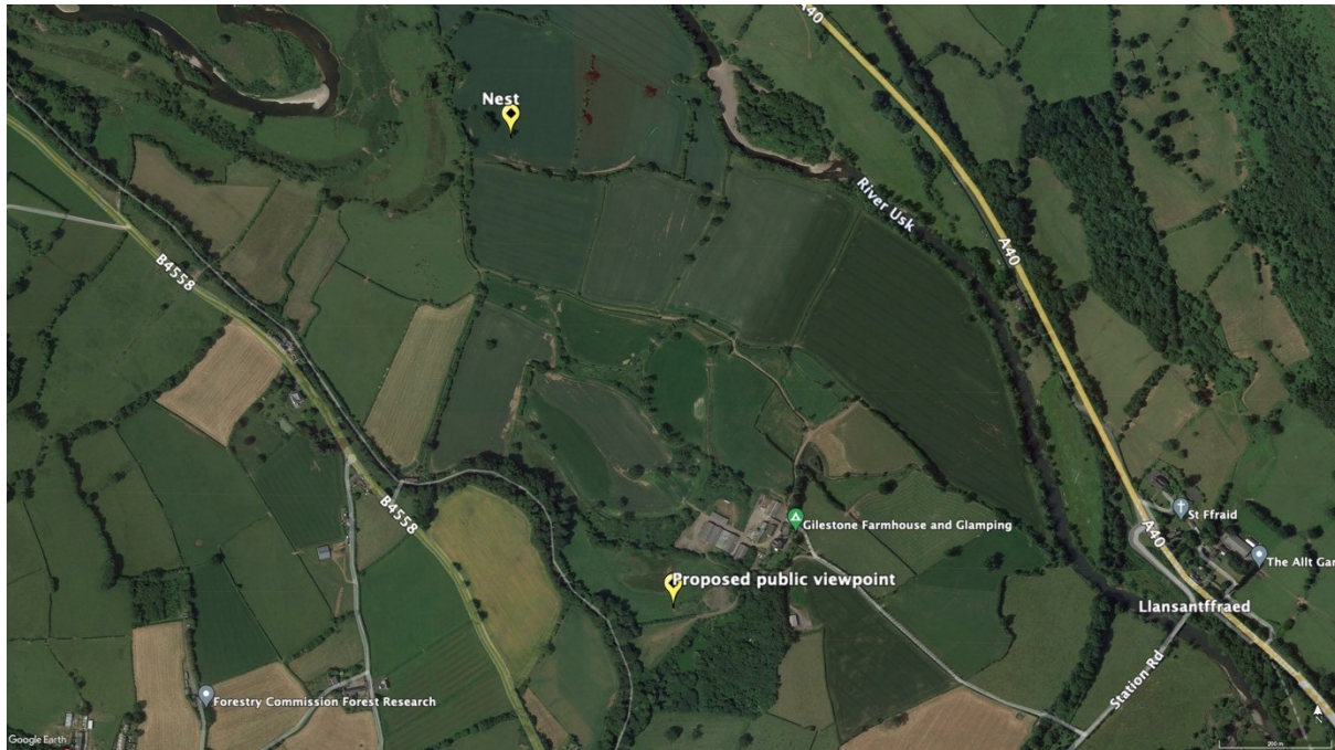
Llun 14. Lleoliad man gwyllo arfaethedig i'r cyhoedd yn Fferm Gilestone.

Byddai angen tywyswyr arbenigol i arwain sesiynau gwyllo i'r cyhoedd, ac felly gallai fod yn ddefnyddiol sefydlu grŵp gwirfoddol i gefnogi cyflwyno'r gwaith hwn (adran 5.7). Neu, gellid sefydlu partneriaeth gyda sefydliad cadwraeth neu dwristiaeth lleol. Er enghraifft, mae Ymddiriedolaeth Natur Gogledd Cymru yn rhedeg man gwyllo Gweilch y pysgod yn Llyn Brenig, sy'n eiddo i Dŵr Cymru. Mae grŵp Cyfeillion Gweilch y pysgod y Wysg yn cael ei sefydlu ar hyn o bryd a gall hyn fod yn ffynhonnell werthfawr o wirfoddolwyr brwdfrydig iawn. Byddai hyn yn ffordd wych i'r gymuned leol gymryd rhan mewn gweithgareddau ar y fferm a byddai'n dilyn esiampl Glaslyn yng Ngogledd Cymru, lle mae man gwyllo'r Gweilch y pysgod yn fenter a arweinir gan y gymuned ac yn cael ei rhedeg gan Bywyd Gwylt Glaslyn Wildlife, fel y soniwyd uchod.