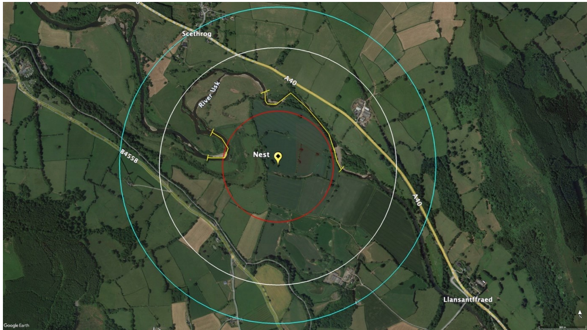
Llun 13. Parthau o amgylch y nyth. Coch = parth gwaharddiad, gwyn = parth cyfyngiad, glas = parth allanol, melyn = parthau dim pysgota.