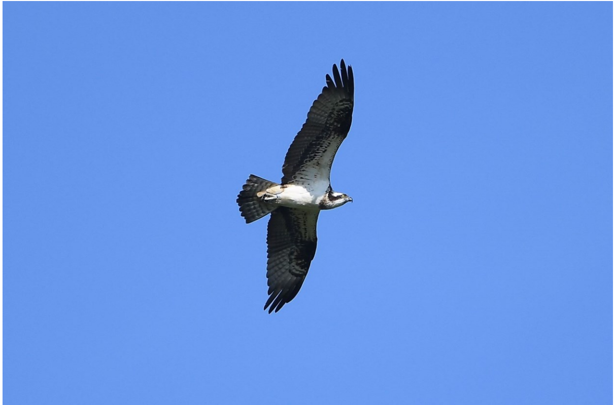
Llun 1. Gwalch y pysgod benywaidd â modrwy las ar ei choes dde, Llyn Llan-gors ar 28 Mai 2023

Ar 1 Mehefin, gwelwyd Gwalch y pysgod cyntaf y flwyddyn yn Fferm Gilestone. Roedd dau aderyn, gwryw heb fodrwy a benyw â modrwy las ar ei choes dde (yr aderyn a welwyd yn Llyn Llan-gors ar 28 Mai mwy na thebyg) yn clwydo gyda'i gilydd ar goeden farw yn Fferm Gilestone ar 17 Mehefin a chredir i'r gwryw ddechrau adeiladu nyth tua'r adeg hon. Nid oedd nyth yno ar 1 Mehefin, ond erbyn diwedd y mis roedd strwythur sylweddol wedi'i adeiladu ym mhen uchaf coeden dderw ger yr afon, gan y Gweilch y pysgod, gyda'r mwyafrif ohono wedi'i wneud gan y gwryw yn ôl pob tebyg (Llun 2). Dyma adeg arferol y flwyddyn i Weilch y pysgod ifanc adeiladu nyth.