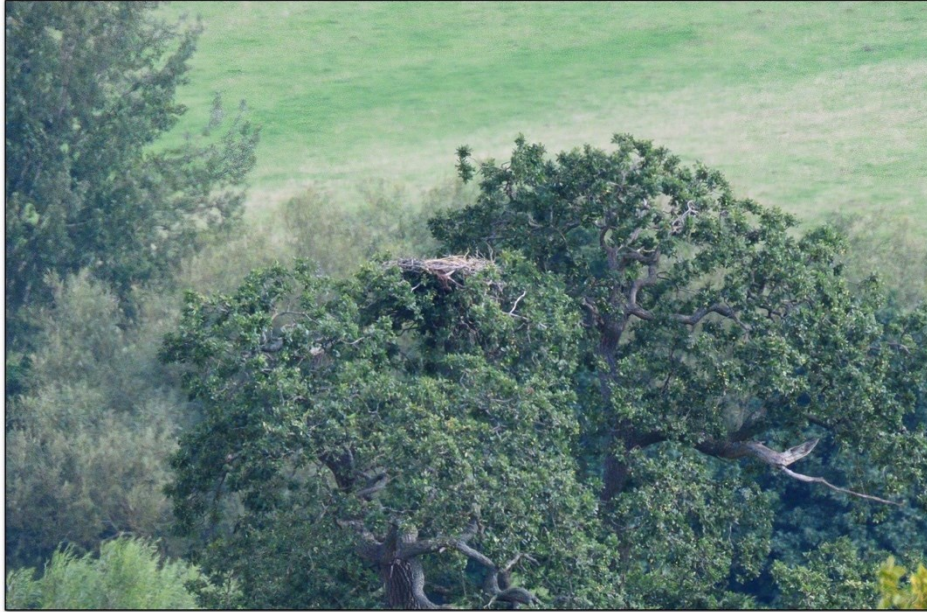
Llun 4. Golwg o'r nyth, a gymerwyd ar 26 Awst 2023.

Ni welwyd yr aderyn benywaidd ar ôl 28 Awst, ond arhosodd y gwryw yn Fferm Gilestone tan ddechrau mis Medi, ac fe'i gwelwyd diwethaf ar y 6 ed .