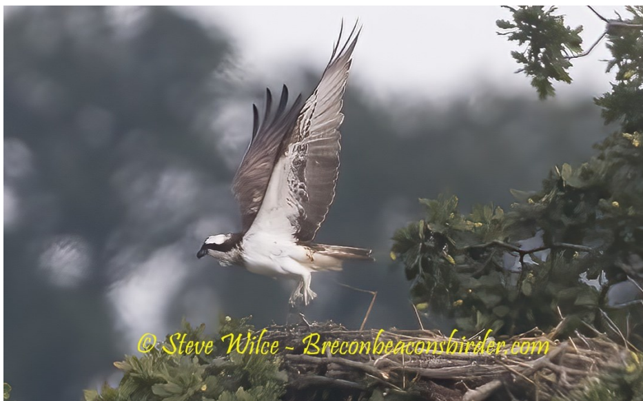
Llun 3. Y gwryw heb fodrwy yn hedfan o'r nyth.

Arhosodd y ddau aderyn yng nghyffiniau'r nyth yn Fferm Gilestone am weddill yr haf ac fe'u gwelwyd yn aml yn Llyn Llan-gors hefyd. Gwelwyd maint y nyth yn tyfu yn ystod mis Gorffennaf a mis Awst (Llun 4) ac roedd y ddau aderyn yn dal yno gyda'i gilydd ar 28 Awst pan dynnwyd llun ohonynt mewn coeden farw ger y nyth (Llun 5).