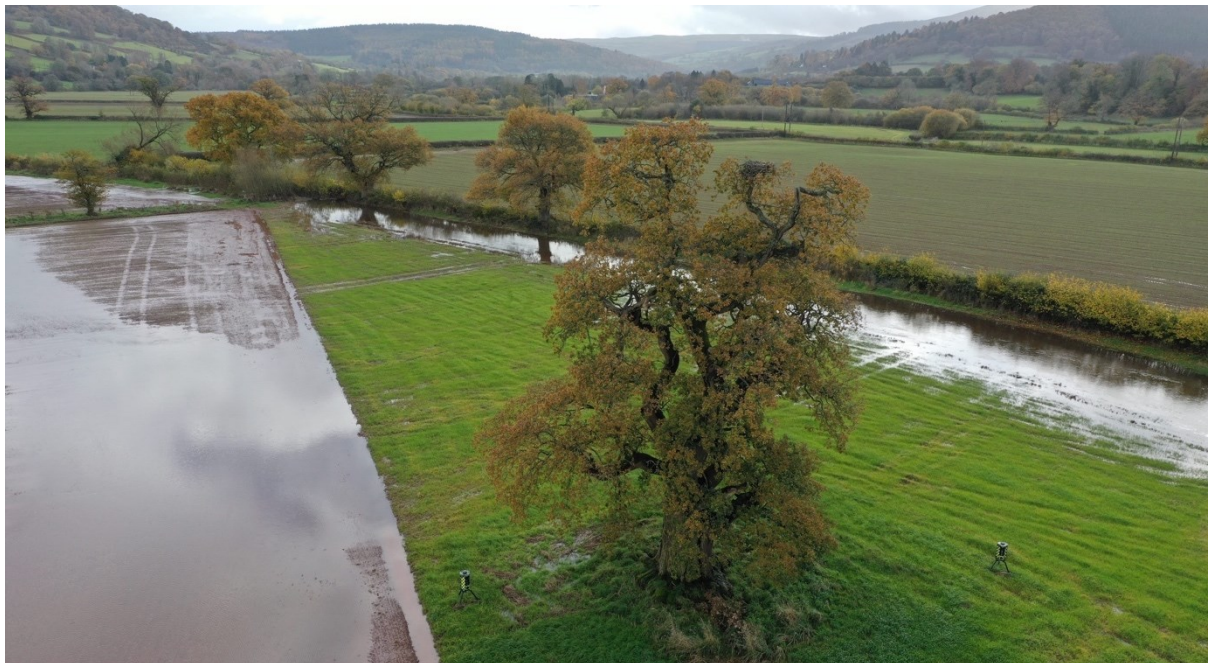
Llun 8. Golwg o'r nyth a choeden y nyth o ddrôn, mis Tachwedd 2023