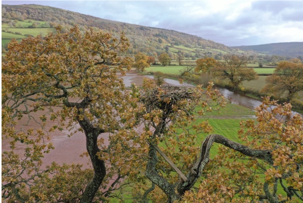
Llun 9. Golwg drôn o'r nyth lle gellir gweld y cynhalbren olaf sy'n weddill o'r nyth artiffisial gwreiddiol.

Ar 14 Tachwedd, dros ddeufis ar ôl i'r Gweilch y pysgod adael y safle, cynhaliwyd archwiliad gweledol o'r nyth gan ddefnyddio drôn. Roedd bron yr holl strwythur yn gyfan er gwaethaf y glaw trwm a'r gwyntoedd cryfion diweddar, ond nodwyd bod y canghennau sy'n cynnal y nyth i'w gweld yn gymharol wan, ac o bosibl, mewn perygl o dorri (Llun 9 a Llun 10).