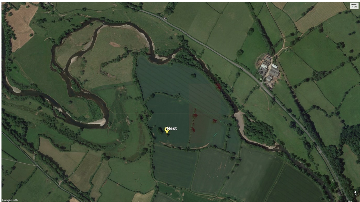
Llun 6. Delwedd o'r awyr yn dangos lleoliad y nyth, yn agos i Afon Wysg.

Mae'r nyth wedi'i leoli ar frig derwen sydd wedi'i lleoli mewn caeau âr yn gyfagos i Afon Wysg, yng ngogledd-orllewin tirdaliad Fferm Gilestone (Llun 6 a Llun 7). Gwelwyd y Gweilch y pysgod yn fforio yn rheolaidd yn Llyn Llan-gors, sydd 1.6 milltir i'r gogledd-ddwyrain, ac yn Afon Wysg, yn ystod haf 2023. Mae'n ddiddorol nodi bod nyth artiffisial wedi'i adeiladu yn yr un goeden dros 15 mlynedd yn ôl mewn ymdrech i ddenu Gweilch y pysgod i'r ardal, ond ni fu'n llwyddiannus (A. King sylw personol . 2023). Ni ofalwyd am y strwythur ac yn y pen draw fe'i chwythwyd o'r goeden, gan adael dim ond un cynhalbren tua un metr islaw'r nyth naturiol a adeiladwyd gan y Gweilch y pysgod yn 2023. Mae hyn i'w weld yn Llun 9.