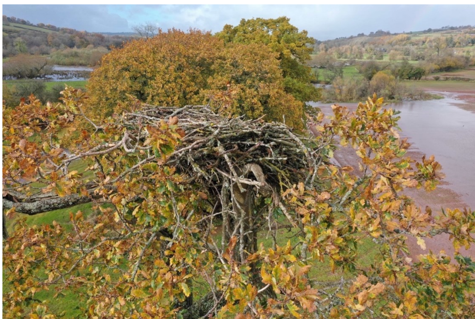
Llun 10. Golwg drôn o'r nyth, yn dangos y canghennau cynhaliol.