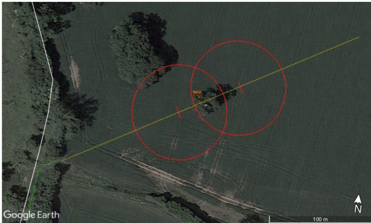
Llun 12. Lleoliad camerâu darganfod tresmasu, wedi'u lleoli'r naill ochr a'r llall i goeden y nyth.

waith. Bydd camerâu teledu cylch cyfyng yn cael eu gosod wrth brif fannau mynediad y fferm yn ystod gaeaf 2023/24.