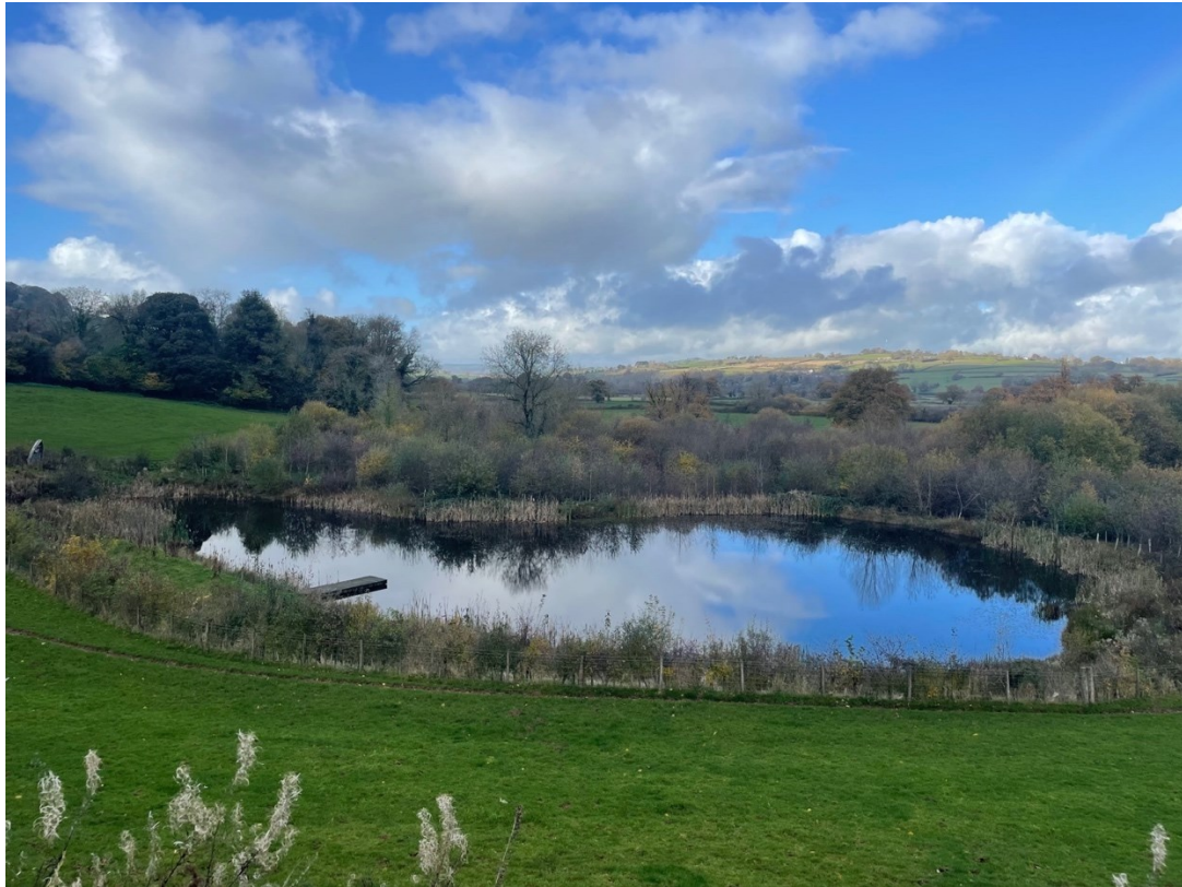
Llun 17. Y pwll mawr yn agos i fan gwyllo arfaethedig Gweilch y pysgod Fferm Gilestone.