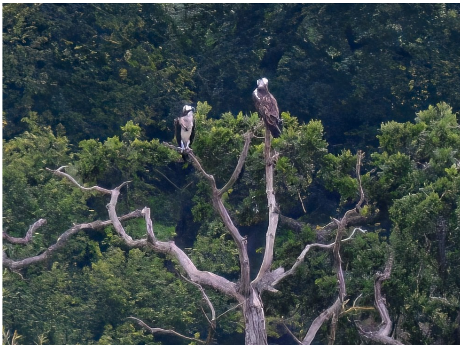
Llun 5. Y pâr Gweilch y pysgod (benyw ar y chwith) yn Fferm Gilestone ar 28 Awst 2023.

Ni welwyd yr aderyn benywaidd ar ôl 28 Awst, ond arhosodd y gwryw yn Fferm Gilestone tan ddechrau mis Medi, ac fe'i gwelwyd diwethaf ar y 6 ed .