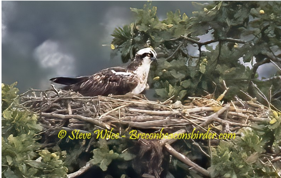
Llun 2. Y gwryw heb fodrwy yn clwydo ar y nyth.