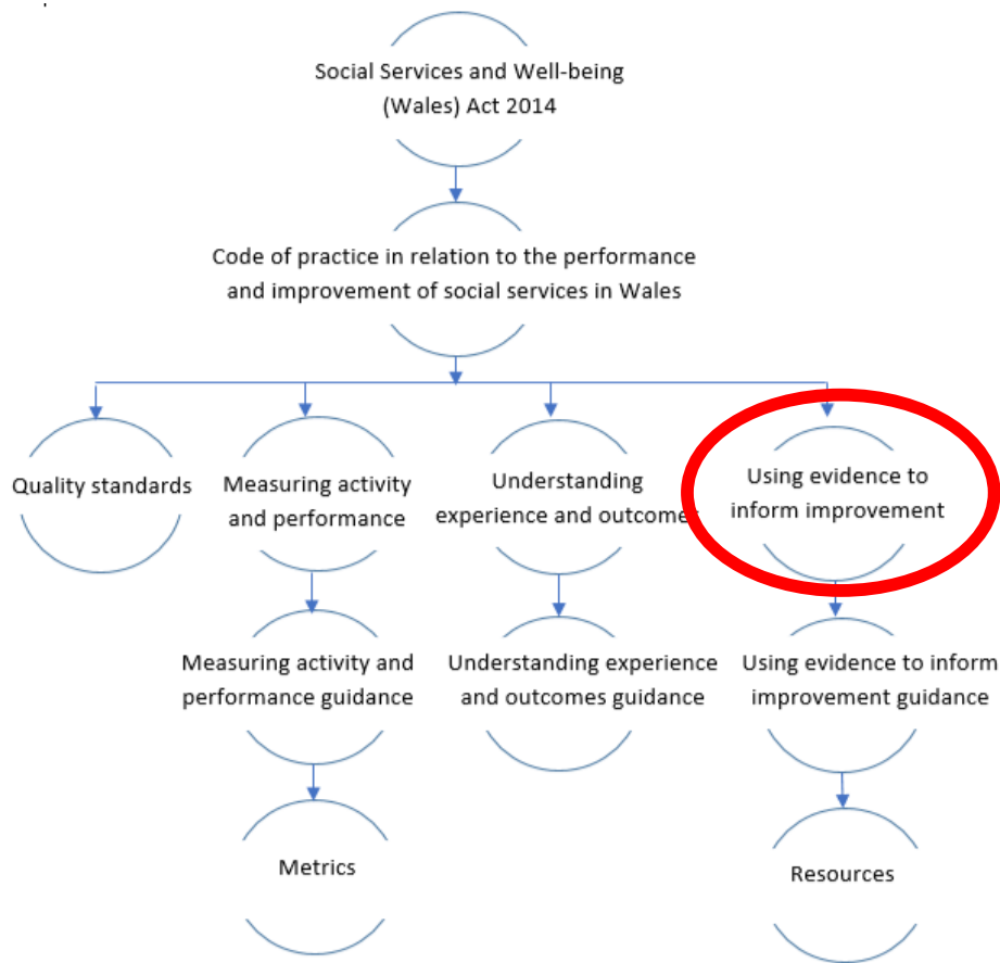
Ffigwr 1Y canllawiau mewn cyd-destun

Mae'r canllawiau hefyd yn cefnogi mentrau strategol eraill, e.e.: