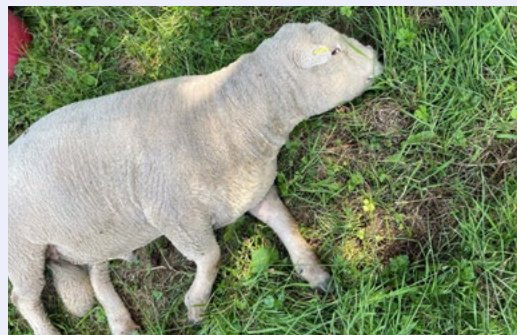
Anifail yn methu codi

Darganfyddwch fwy o wybodaeth a sut i adrodd am y tafod glas drwy ymweld www.gov.wales/bluetongue