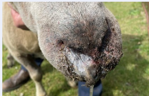
Llif o'r trwyn