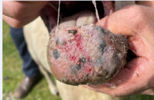
Briwiau yn y geg