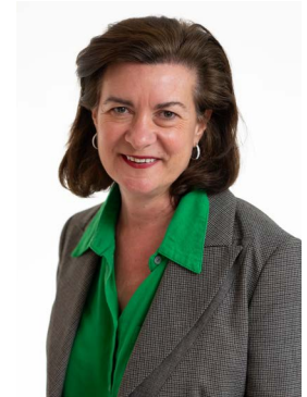
Eluned Morgan AS

Gadewch inni symud ymlaen gyda phenderfyniad a gobaid, gan wybod y bydd ein hymdrechion ar y cyd yn helpu i greu cymdeithas fwy cyfiawn, gwrth-hiliol a theg i bawb.