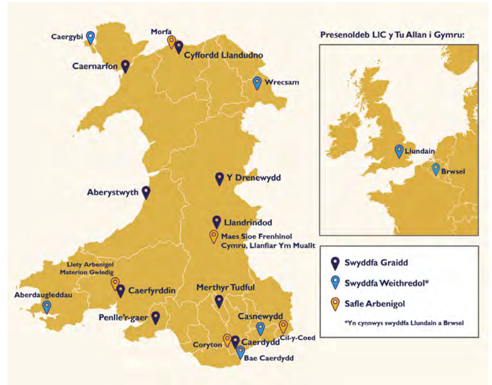
Ffigur 1: Lleoliad Swyddfeydd yr Ystad Weinyddol

Atodiad 5: Crynodeb o Berfformiad Eiddo Arbenigol yr Ystad.