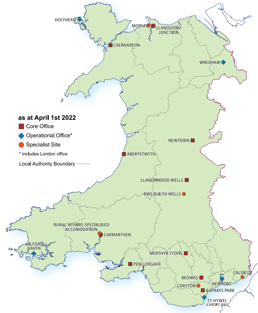
Ffigur 1: Lleoliad swyddfeydd craidd Llywodraeth Cymru