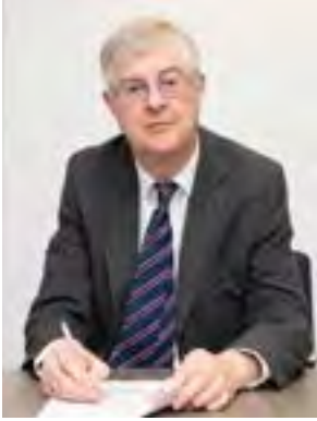
Mark Drakeford AS