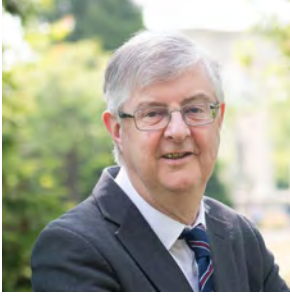
Mark Drakeford AS