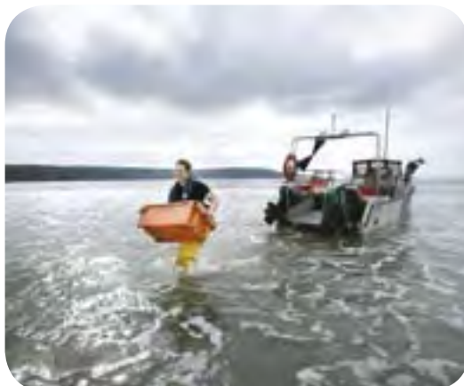
Dash Shellfish, Broadhaven, Sir Benfro

Byddwn yn ceisio sicrhau'r buddion mwyaf posibl o'r cronfeydd sydd ar gael yng Nghymru. Rydym am weld buddsoddiadau yn y dyfodol yn cael eu defnyddio i ddatblygu cymunedau pysgota, arloesi mewn meysydd megis diogelu'r amgylchedd, casglu data, ymchwil wyddonol, dyframaethu a rheolaeth ar weithrediadau pysgota.