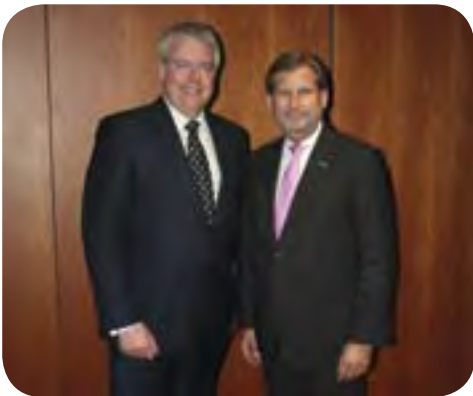
Y Prif Weinidog Carwyn Jones gyda Chomisynydd Polisi Rhanbarthol Ewrop Johannes Hahn.

Rydym yn ymrwymedig i sicrhau'r budd mwyaf posibl o'r Cronfeydd Strwythurol a neilltuir i Gymru. Byddwn yn cefnogi nifer llai o brosiectau mwy strategol a'n bwriad yw canolbwyntio ar greu twf a swyddi cynaliadwy.