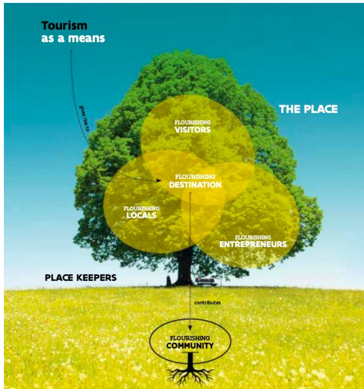
Ffigur 1 Mae'r Goeden Linden yn esbonio gweledigaeth VisitFlanders ar gyfer cyrchfan sy'n ffynnu.

Maent yn nodi y dylai nod strategol ganolog twristiaeth yn Fflandrys ganolbwyntio ar alluogi Fflandrys i ffynnu fel cyrchfan i drigolion, entrepreneuriaid a thwristiaid fel ei gilydd. Defnyddir y goeden Linden fel trosiad ar gyfer hyn, fel y dengys ffigur 1 isod.