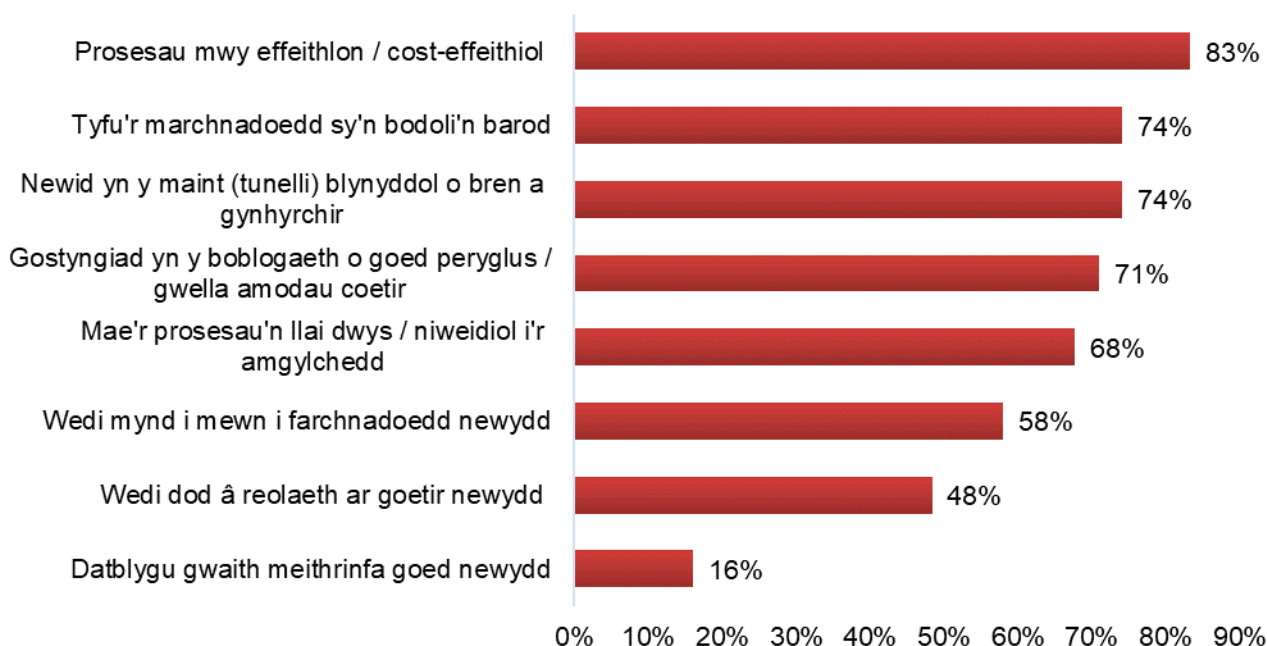
Ffigur 6.1: Canlyniadau a adroddwyd gan fuddiolwyr (cwestiwn ‘ticiwch bob un sy’n berthnasol)