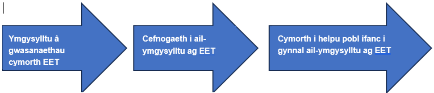
Ffigur 5.1. Cymorth i ailymgysylltu